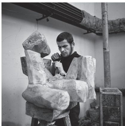
Fot. 1. Student przy pracy w pracowni rzeźby prof. Franciszka Duszeńki (1969)

Wspomniany zbiór fotografii trafił do Biblioteki Akademii Sztuk Pięknych w Gdańsku w 2017 r., częściowo uporządkowany przez archiwistę uczelnianego i wciąż opracowywany. Zajmuje się tym archiwista będący pracownikiem Biblioteki. Obecnie zbiór ten liczy ponad 60 tysięcy klitek negatywów z lat 1947–2007. Zdjęcia można podzielić na kilka tematów. Największą grupę stanowią te przedstawiające poszczególne pracownie i studentów w czasie zajęć (fot. 1). Na kliszach uwiecznione zostały również ważne wydarzenia z dziejów Państwowej Wyższej Szkoły Sztuk Plastycznych (fot. 2) i liczne wystawy organizowane na Uczelni (fot. 3).