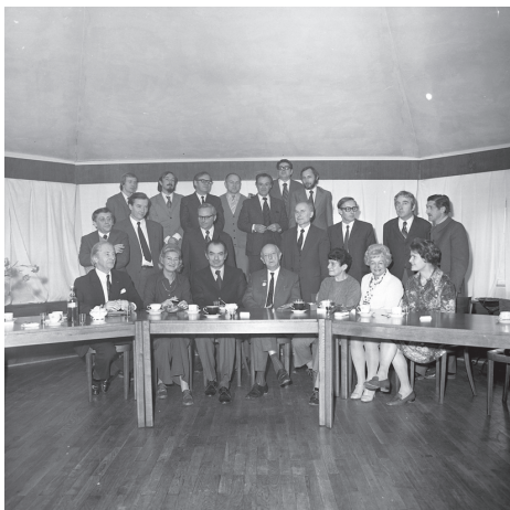
Fot. 4. Zdjęcie grupowe po zakończeniu posiedzenia Rady Wydziału (1970)

W albumach można obejrzyć zdjęcia z posiedzeń Rady Senatu, Rad Wydziałów (fot. 4; por. też fot. 5), z wizyt znanych osób, które odwiedziły Uczelnię, plenerów, egzaminów wstępnych (fot. 6) itp. Oddzielnie opracowano zbiór zawierający prace dyplomowe studentów. Dużą popularnością cieszą się portrety dydaktyków i zdjęcia przedstawiające charakterystyczne wystroje pracowni.