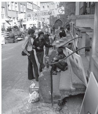
Fot. 7. Plener malarski studentów szkół plastycznych krajów nadbałtyckich „FART 72” (1972)

Do rzadkości należą zdjęcia wykonane podczas juwenaliów PWSSP czy prezentujące działalność teatru studenckiego CO TO. Warto też zwrócić uwagę na kolekcję fotografii z międzynarodowego pleneru malarskiego „FART” z roku 1972 (fot. 7).