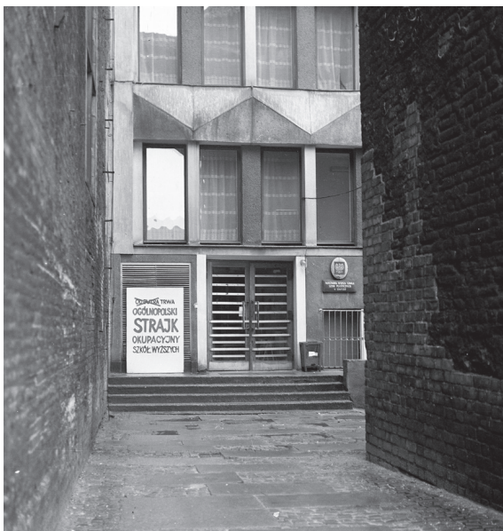
Fot. 10. Strajk okupacyjny szkół wyższych (1981)

Źródło: Fot. Witold Węgrzyn, sygn. II/245/1.