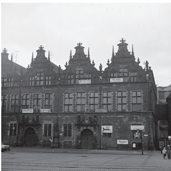
Fot. 11. Strajk okupacyjny szkół wyższych (1981)