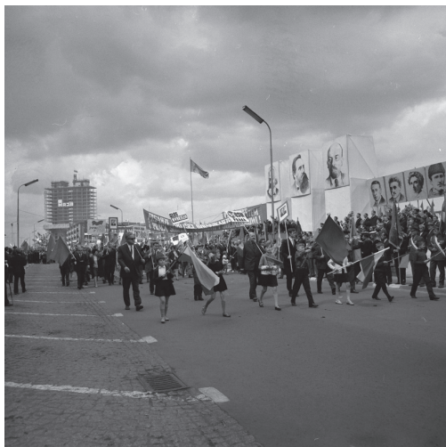
Fot. 12. Przedstawiciele PWSSP w pochodzie pierwszomajowym (lata siedemdziesiąte XX w.)