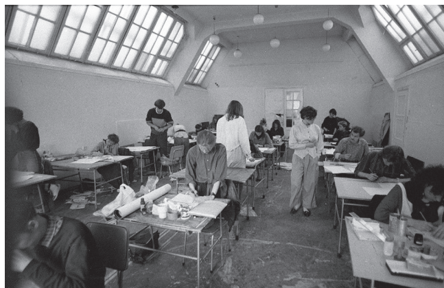
Fot. 14. Egzamin wstępny na PWSSP w roku 1989

W tym wypadku jest to zdjęcie pt. Egzamin wstępny na PWSSP w roku 1989 (fot. 14). Dzięki temu można szybko wyszukać zdjęcie i jeżeli istnieje taka potrzeba, ponownie zeskanować interesującą fotografię. Obecnie część inwentarza jest udostępniona w wersji elektronicznej na stronie internetowej ASP, w zakładce Biblioteka i Archiwum, podstrona Archiwum ( Archiwum fotograficzne , cz. 1–3).