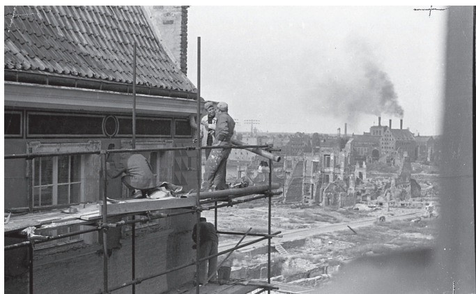
Fot. 8. Widok z rusztowania na zniszczony Gdańsk (lata pięćdziesiąte XX w.) Źródło: Fot. Zygmunt Szymoniak, sygn. X/46/358.

Fotografie wchodzące w skład omawianego zbioru odzwierciedlają nie tylko życie szkoły, ale także życie poza murami Uczelni. Wymienić tu można np. dekorowanie przez artystów malarzy i rzeźbiarzy odbudowanych po II wojnie światowej kamienic Głównego Miasta Gdańska (fot. 8 i 9) czy kolekcję dokumentującą strajk uczelni wyższych w Polsce w grudniu 1981 r., w którym wzięli udział pracownicy PWSSP (fot. 10 i 11). Zachowało się też dużo zdjęć przedstawiających pochody pierwszomajowe w Gdańsku (fot. 12).