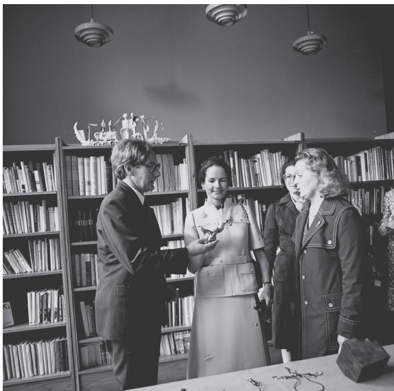
Fot. 2. Wizyta żony prezydenta Francji, Anne-Aymone Giscard d'Estaing w PWSSP (1975)

Źródło: Fot. Witold Węgrzyn, sygn. II/297/9.