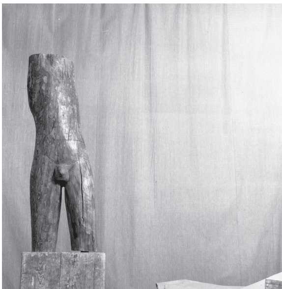
Fot. 3. Akt męski autorstwa prof. Adama Smolany (1962)