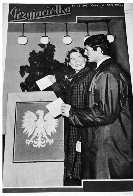
Przyjaciółka, nr 22, 1965