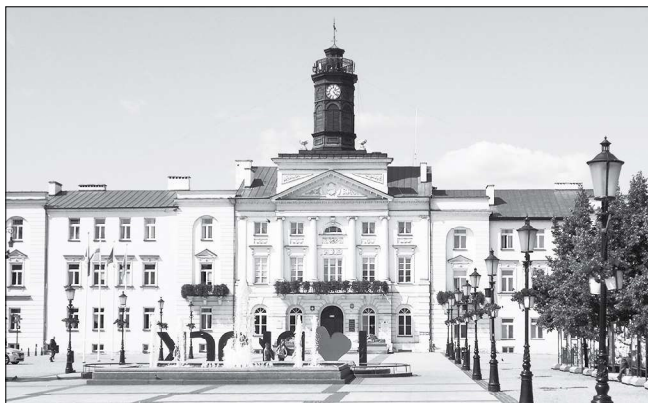
Ratusz w Płocku. Siedziba Prezydenta miasta Płocka i Rady Miasta

Statut został opublikowany w Dzienniku Urzędowym Województwa Mazowieckiego w dniu 5 listopada 2018 r. 11 Wszedł on w życie w terminie 14 dni od daty opublikowania i ma zastosowanie do kadencji Rady Miasta Płocka następującej po kadencji, w której uchwała została podjęta.