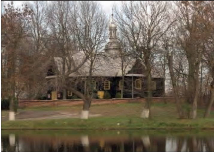
Fot. 1. Kościół w Rossoszycy (2010 r.)

W okresie minionych ponad 200 lat kościół był wielokrotnie remontowany. Przypadająca na 2016 r. rocznica 600-lecia powołania parafii rossoszyckiej stanowiła inspirację do pojęcia w 2014 r. kolejnego, gruntownego (trwającego do dziś) remontu tego zabytkowego obiektu.