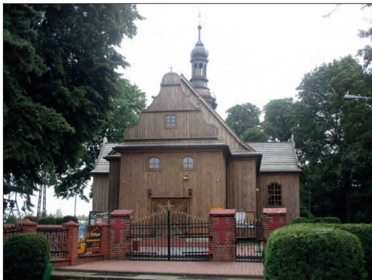
Fot. 4. Kościół w Rossoszycy w 2017 r.

żym wyzwaniem będzie planowane malowanie wnętrza kościoła. Na podstawie analizy starszych warstw malarskich próbuje się ustalić dawny wystrój wnętrza, jak również zidentyfikować stosowane niegdyś techniki malarskie. Stwierdzenie użycia bieli cynkowej (stosowanej od 1850 roku!) w najwcześniejszym odkrytym opracowaniu kolorystycznym drewnianych ścian i drewnianego pseudo-sklepienia kościoła (datowanego na 1783 r.) pozwala przypuszczać, że był on przez dłuższy czas bez opracowania barwnego lub pierwotne malatury nie zachowały się. W celu uniknięcia błędów popełnianych w przeszłości, wszystkie te prace przebiegają pod ścisłą kontrolą konserwatora zabytków (zadania tego podjęła się Monika Bystrowska-Kunat – specjalista w zakresie konserwacji malarstwa i rzeźby polichromowanej). Finalny etap prac konserwatorskich obejmie renowację rzeźb i obrazów znajdujących się w ołtarzach pozostających na wyposażeniu kościoła.