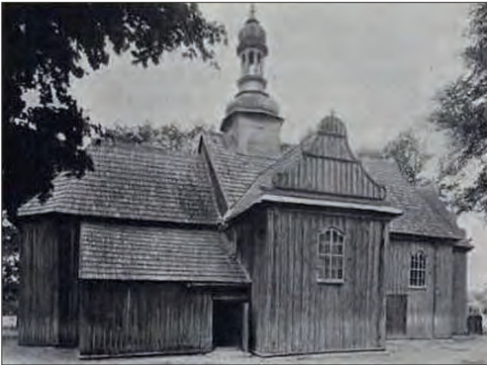
Fot. 2. Kościół w Rossoszycy (początek XX w.)

Ponieważ stan zabytkowego kościoła w Rossoszycy budził wiele zastrzeżeń, w 2012 r. mieszkańcy parafii postanowili podjąć działania mające na celu wykonanie gruntownego remontu świątyni. Zgodnie z zapisem protokołu nr 1/2012 z zebrania wiejskiego 48 , parafianie poprosili ówczesnego proboszcza, ks. Krzysztofa Czyżaka, o powołanie rady parafialnej i rozpoczęcie starań w sprawie remontu. Proboszcz jednak odmówił współpracy, tłumacząc to złym stanem zdrowia i zamiarem opuszczenia parafii. Pod naciskiem zebranych osób powołano Społeczną Komisję ds. Remontu Kościoła w Rossoszycy. Kolejnym krokiem było utworzenie Społecznego Komitetu Remontu Kościoła pw. św. Wawrzyńca w Rossoszycy 49 , który zainicjował zbiórkę pieniędzy wśród parafian (20 zł na miesiąc od rodziny, 10 zł od osób samotnych) 50 . Zebrane fundusze wpłacano na otwarte konto bankowe. Zaangażowanie i determinacja społeczności lokalnej ostatecznie doprowadziła do podjęcia gruntownej renowacji rossoszyckiej świątyni.