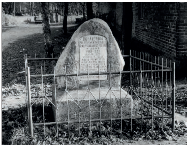
Fot. 4. Obelisk ku czci poległych w walkach o niepodległość w latach 1918–1920 w Starostwie Szadek, stan przed 1977 r.