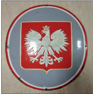
Fot. 5. Godło II Rzeczypospolitej z budynku gromady Kolonia Starostwo gminy Szadek z czasów, gdy zbudowano obelisk; godło ukryte i zabezpieczone przetrwało czas okupacji niemieckiej

zapoczątkowała na ziemi szadkowskiej tradycje pamięci i czci wobec żołnierzy wojska polskiego, którzy w tragicznych dla Polski chwilach grożących utratą niepodległości wstąpili w szeregi wojska polskiego, a następnie Armii Ochotniczej, i oddali życie dla ojczyzny. Obelisk stał się „nośnikiem” pamięci historycznej. W okresie zapomnienia, zwłaszcza w latach 1945–1954, pełnił funkcję poznawczą, informującą o wydarzeniach istotnych dla polskiej tożsamości narodowej. Głaz przywołuje pamięć o żołnierzach oraz dowodzi, że społeczeństwo ziemi szadkowskiej wniosło wkład w niepodległościowe czyny Polaków.