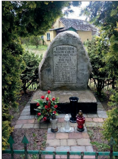
Fot. 1. Obelisk w Starostwie Szadek ku czci żołnierzy poległych w walkach o niepodległość w latach 1918–1920, wygląd współczesny