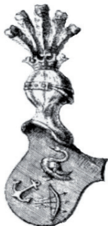
Herb Oszyk na pieczęci używanej przez Henryka Sienkiewicza 12 .