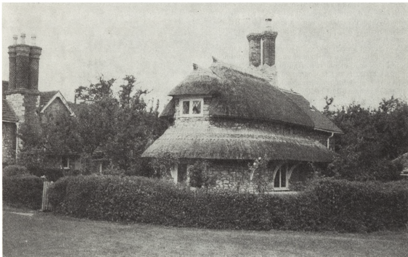
1. Blaise Hamlet niedaleko Bristolu, arch. J. Nash, 1811 r.