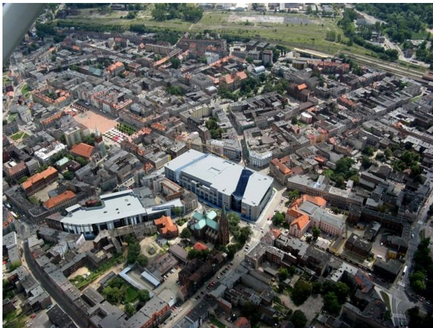
Ryc. 5. Galeria Agora i parking z lotu ptaka

Parkingi dla klientów Agory Bytom umieszczono w sąsiednim kwartale, pomiędzy ulicami Kwietniewskiego, Browarnianą, Webera i Jainty. Parking wielopoziomowy znajduje się bardzo blisko Agory Bytom, prowadzi do niego ul. Browarniana, jedna z typowych, kameralnych ulic centrum Bytomia o niepowtarzalnej atmosferze. Co bardzo ważne, parking posłuży nie tylko klientom galerii, ale także innym użytkownikom centrum miasta.