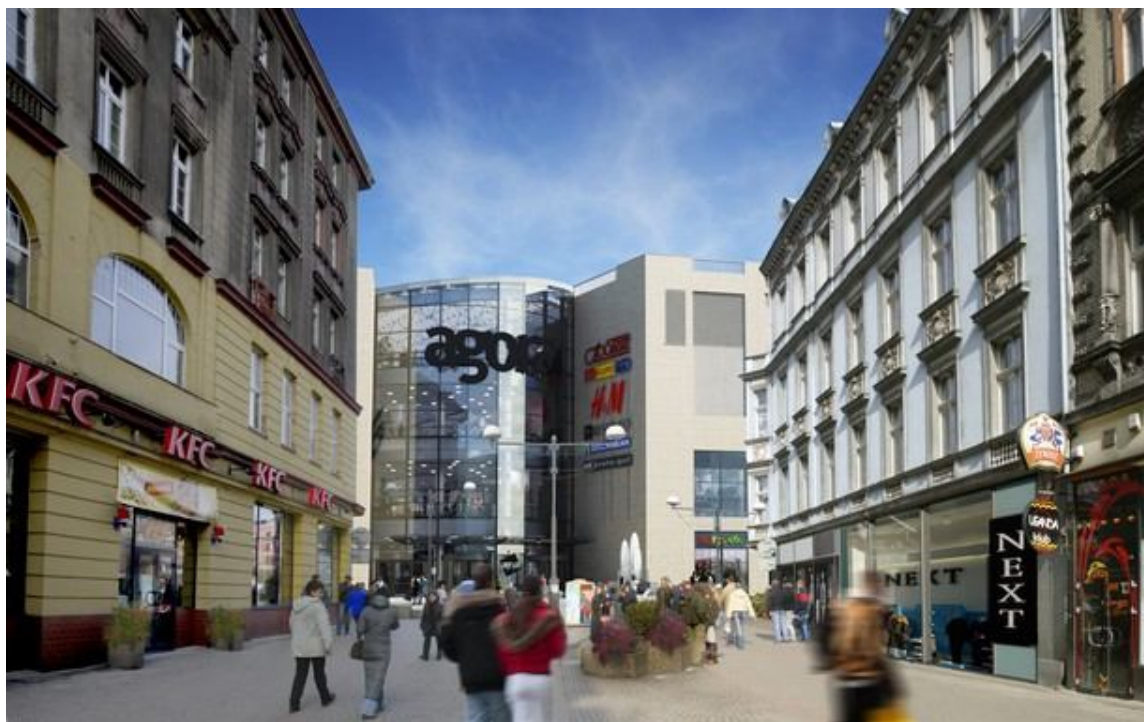
Ryc. 3. Galeria Agora, widok z ulicy Dworcowej

Właśnie na tej osi handlowej zlokalizowany został teren inwestycji, zwany często kwartałem placu Kościuszki, przy którym zbudowana jest Agora Bytom (ryc. 3). Uzupełnieniem tego układu jest trzecia oś – parkowa, z pięknym terenem rekreacyjnym.