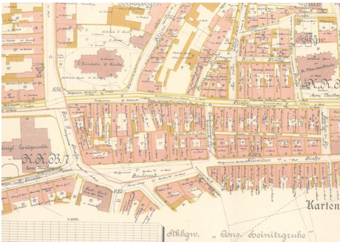
Ryc. 2. Mapa katastralna rejonu placu Boulevard przed rokiem 1918