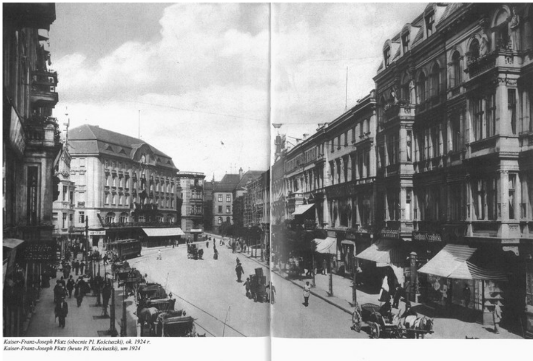
Kaiser-Franz-Joseph Platz (obecnie Pl. Kościuszki), ok. 1924 r. Kaiser-Franz-Joseph Platz (heute Pl. Kościuszki), um 1924