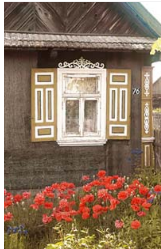
3. Kraina Otwartych Okiennic, Trześcianka, ze zbiorów ROBiDZ w Białymstoku.

Meczety w Bohonikach i Kruszynianach stanowią – nie mający w Polsce analogii – przykład drewnianego budownictwa sakralnego; to dwie główne miejscowości na terenie województwa