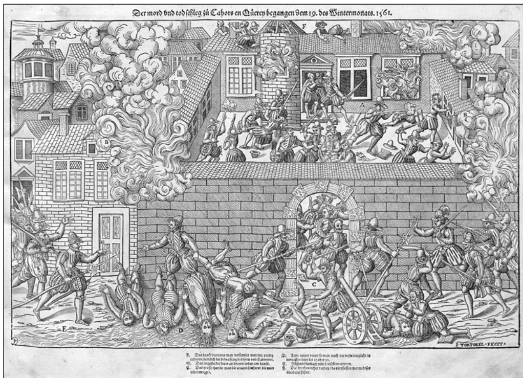
3. Masakra w Cahors 19 listopada 1561 roku.

zewnątrz – na bliższy czytelnikowi pierwszy plan. Tam ma miejsce regularna rzeź, niewiele różniąca się od uboju zwierząt. Ciała martwych hugenotów układane są prostopadłe do muru. Cieknąca z nich struga krwi tworzy potok (E), wypływający poza ramy ryciny. Wśród zabitych z łatwością odróżnić można zwłoki kobiet i mężczyzn. Perrissin i Tortorel szacowali liczbę ofiar na 25–30 osób (D), lecz w rzeczywistości mogła ona sięgać 50 zabitych 37 . Scena jest pełna brutalności i dynamiki. Mordy dokonywane są w dymach i płomieniach wydobywających się z podpalonej zabudowy. Podczas gdy drugi, dalszy plan pełen jest chaosu i bezładnej gonitwy katolików za protestantami, pierwszy plan wydaje się być już uporządkowaną sceną mechanicznego zabijania. Autorzy ryciny dodali ponadto w opisie niewidoczny dla czytelnika element, który został oznaczony przy pomocy litery F w środkowej części górnej krawędzi ilustracji. Mianowicie jest to znajdujący się nieopodal kościół, z którego księża sprowokowali tę krwawą łaźnię. Ukrycie podżegaczy masakry przed wzrokiem czytelnika oraz wyeksponowanie ewidentnego okrucieństwa (mordowanie kobiet i dzieci, odcięte dłonie leżące na dziedzińcu, struga krwi wylewająca się poza ramy ilustracji) nadaje przedstawieniu cech demonicznych i przytłacza odbiorcę ciężarem doznań.