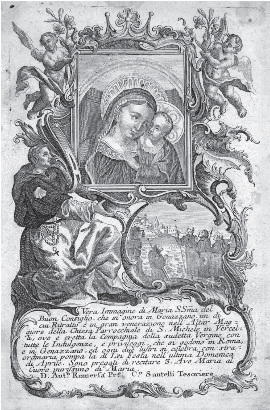
Panna Maria Dobré rady, mědiryt, polovina 18. století.