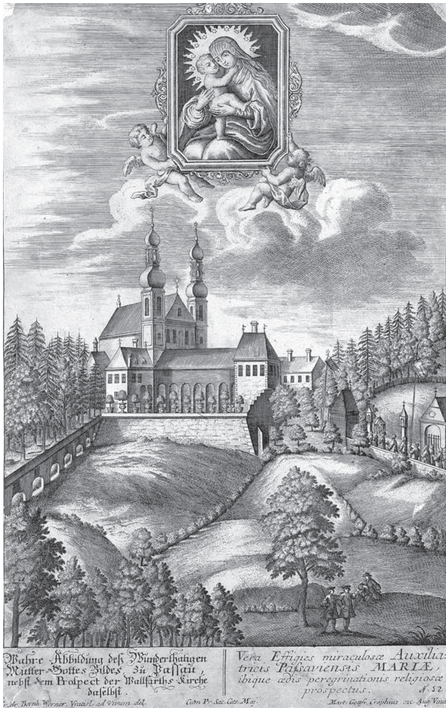
M. G. Gropius podle předlohy B. Wenera, Poutní kostel Panny Marie Pomocné v Pasově, mědiryt, polovina 18. století.