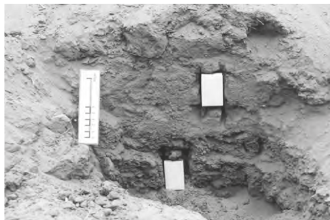
Obr. 4 Pohled na situaci odběru malých mikromorfologických vzorků z rozpadlé a rozplavené zdi ve starém Usli