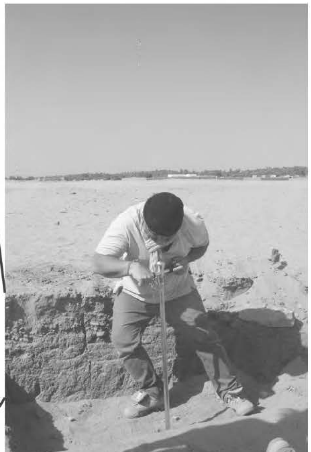
Obr. 3 Stratigrafická situace v severozápadním rohu sondy 4/2015 znázorňující recentní sedimenty (především vátý písek obsahující artefakty) (A), pravděpodobně zánikový horizont z doby fungování „jižního křídla“ (B) a rozplavený materiál starších staveb (C) (měřítka J. Turek; foto L. Lisá, 2015)