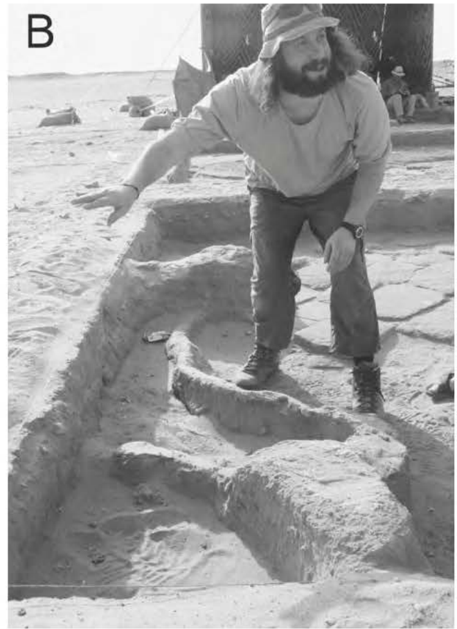
Obr. 5 (A) Staré Usli: sedimentární záznam vzniklý ustájením koz; čím je sediment starší, tím snáze dochází k degradaci organické hmoty, změně struktury a ztrátě vrstevnatosti; (B) lokalita Usli, sonda 4/2015: pseudomorfóza po kořeni stromu, který rostl nad pískovcovou dlažbou v exteriéru stavby označované jako „jižní křídlo“ (měřítko A. Bajer, foto L. Lisá, 2015)

svou funkci a mohl být již zčásti rozebrán (viz též Bárta et al. 2014b). Sedimenty obsahovaly množství spálených kostí, uhlíků a zbytků organického materiálu, laminace sedimentu však byla způsobena přítomností stojaté vody. To by mohlo poukazovat na opakující se závlahu okraje sídliště. Je pravděpodobné, že právě nepropustná pískovcová podlaha dala vzniknout horizontální vrstevnatosti a umožnila lepší zachování stratifikace.