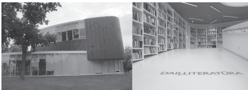
Fot. 2. Biblioteka w Parvenie – widok z zewnątrz oraz jeden z korytarzy

kolorystyka i umeblowanie świadczyły o tym, iż każda z tych bibliotek stanowi istotny punkt na mapie swojej miejscowości i pełni funkcję nie tylko skarbnicy wiedzy, ale i miejsca edukacyjno-kulturalnych spotkań całej społeczności lokalnej.