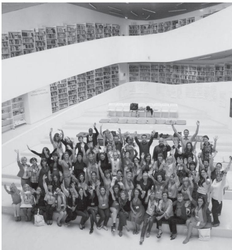
Fot. 6. Pamiątkowe zdjęcie uczestników Międzynarodowej Akademii Młodych Bibliotekarzy wraz z trenerami

torki, Pauliny Milewskiej, przybliżyła uczestnikom Akademii Dominika Paleczna (fot. 5). Projekt wzbudził duże zainteresowanie – zadawano sporo pytań, podawano przykłady lokalnych inicjatyw, jak np. z obecnego na IYLA Suszca, a autorka artykułu przedstawiła zainteresowanym dowody na powodzenie tej akcji w swojej bibliotece. Chęć zorganizowania podobnego wydarzenia w innych krajach była tak duża, że w przerwach między kolejnymi sesjami przygotowano specjalne spotkanie, na którym można było zasięgnąć szczegółowych informacji i odpowiedzieć na pytania gości. O sukcesie polskiego projektu świadczy również fakt, że na spotkaniu podsumowującym Akademię organizatorzy za najlepszy koncept uznali właśnie Odjazdowego Bibliotekarza. W głosowaniu uczestników także znalazł się w czołówce najlepiej ocenianych przedsięwzięć.