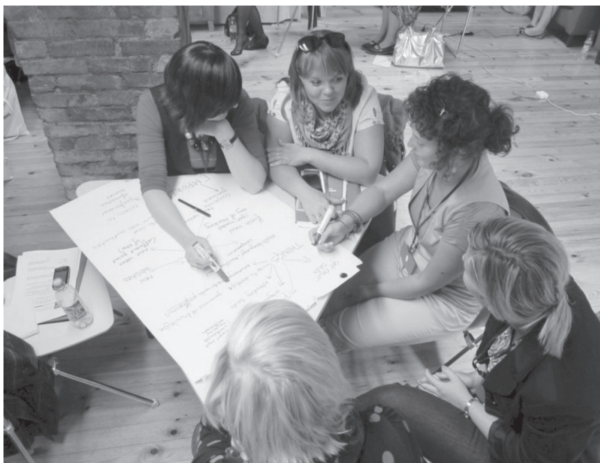
Fot. 1. Uczestnicy Międzynarodowej Akademii Młodych Bibliotekarzy w trakcie warsztatów

kolorystyka i umeblowanie świadczyły o tym, iż każda z tych bibliotek stanowi istotny punkt na mapie swojej miejscowości i pełni funkcję nie tylko skarbnicy wiedzy, ale i miejsca edukacyjno-kulturalnych spotkań całej społeczności lokalnej.