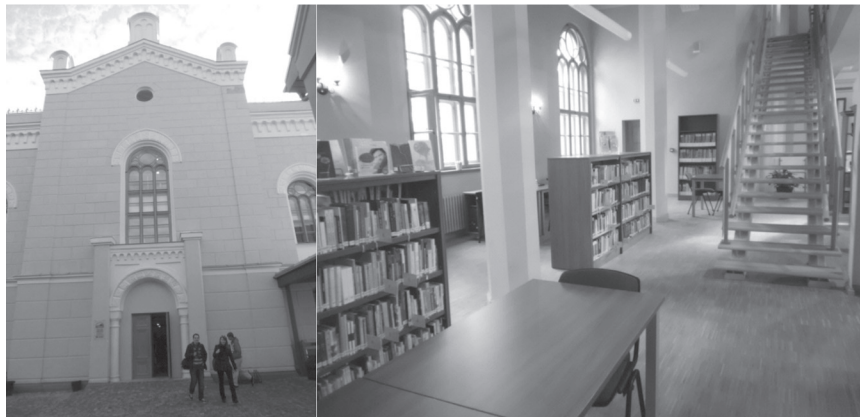
Fot. 4. Biblioteka w Kuldidge, zaadaptowana w byłej synagodze – widok z zewnątrz i jedna z czytelń

W czasie warsztatów i spotkań korzystano ze specjalistycznych pracowni komputerowych, galerii i sal wykładowych. Mnogość i intensywność zajęć nie pozwalały na dłuższe indywidualne zwiedzanie łotewskich miast, jednak najważniejsza była możliwość zdobycia cennej wiedzy – uczestnicy skrupulatnie notowali rady i nowe pomysły oraz dyskutowali w czasie wspólnych posiłków.