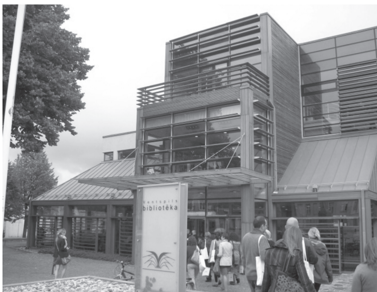
Fot. 3. Biblioteka w Venstpils – widok z zewnątrz