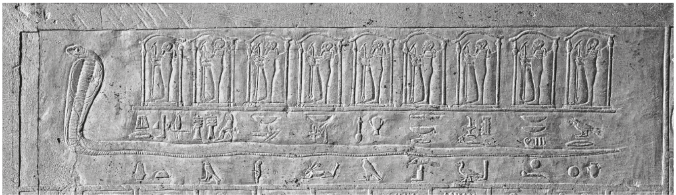
Obr. 4 Had se svatyněmi devíti podob boha Ptaha; oblouk západní stěny lufaovy pohřební komory, severní část / Fig. 4 A snake carrying nine shrines containing an image of the god Ptah; the arch of the western wall of the burial chamber of lufaa, northern part

Nachází se v místnosti z (minerálu) sečet, která je 33 333 loktů dlouhá a otevírá se k osmi branám podsvětí.