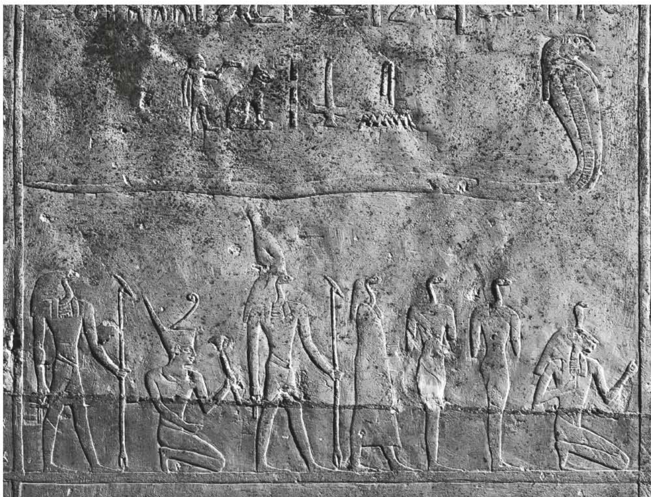
Obr. 1 „Ten, jenž svolává ty, co jsou ve svém ohni“; oblouk západní stěny lufaovy pohřební komory, jižní část / Fig. 1 “The One who Calls those who are in their Fire”; the arch of the western wall of the burial chamber of Iufaa, southern part