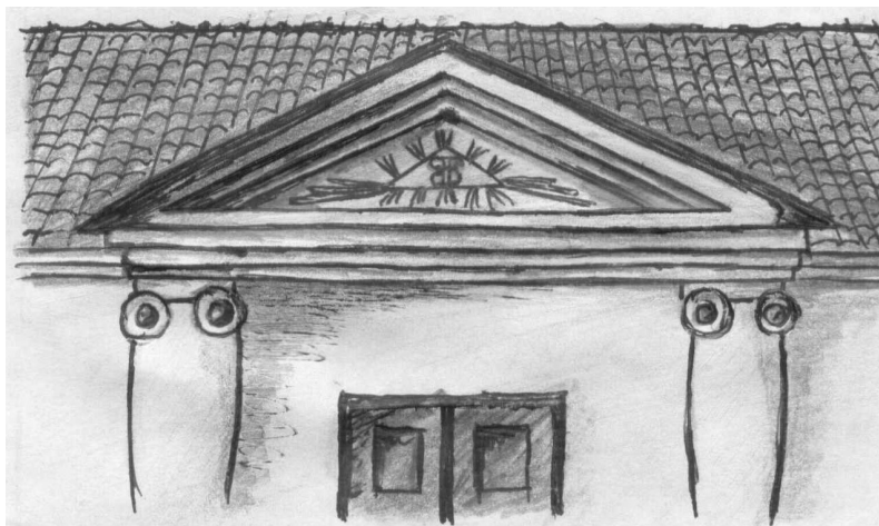
Rys. 4. Trójkątny fronton wejścia głównego

umieszczając właśnie taki symbol, wyraził prośbę do Boga o opiekę i zesłanie harmonijnego ładu na swoje ognisko domowe.