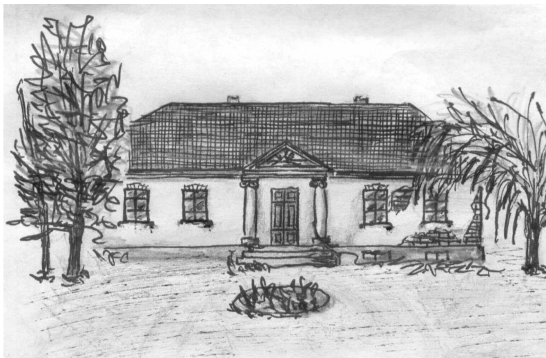
Rys. 2. Dwór w Dziadkowicach (widok części frontowej)

murowane z cegły na zaprawie wapiennej, otynkowane, podpiwniczone, oparte na rzucie prostokąta. Podstawową fizjonomiczną różnicą między dworami ziemi szadkowskiej jest ich wielkość i to ona prowadzi w konsekwencji do dalszego zaostrażania kontrastu między nimi. Dwory w Prusinowicach i Rzepiszewie są duże, piętrowe, natomiast w Dziadkowicach jest niewielki, parterowy (rys. 2).