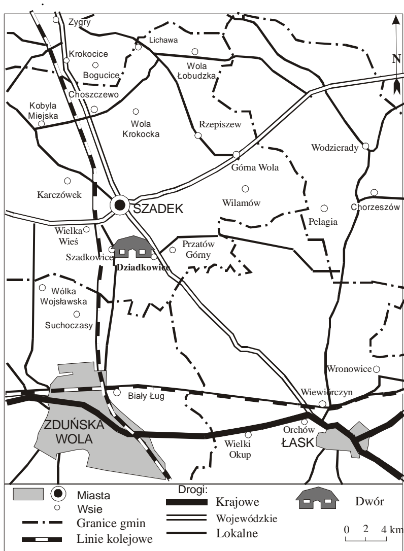
Rys. 1. Położenie dworu w Dziadkowicach.