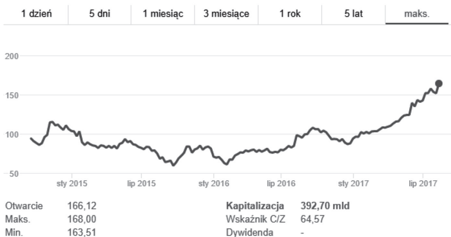
Rys. 2. Wartość grupy Alibaba w latach 2015-2017

Źródło: [ http://www.spidersweb.pl/2017/08/alibaba-aliexpress-amazona.html (dostęp: 11.09.2017)].