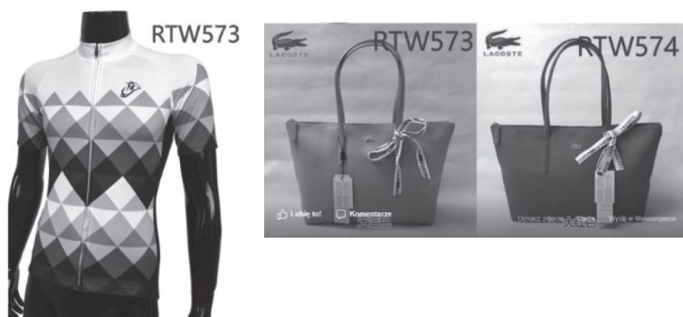
Rys. 4. Problem aukcji ukrytych na platformie AliExpress

Innym dość powszechnym precedensem, z którym platforma sprzedażowa AliExpress stara się walczyć, jest tzw. problem aukcji ukrytych, na których sprzedawane są podróbki towarów znanych światowych marek. Chcąc zrozumieć to zjawisko, warto przyrzeć się fotografii na rys. 4.