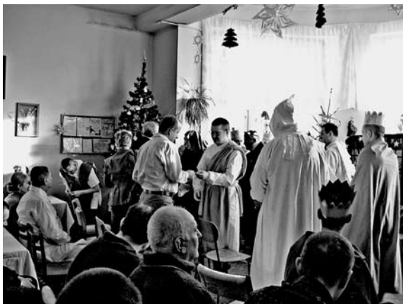
Rycina 3. Jasełka (wg [4])

ci, którzy biorą udział w przygotowaniu dekoracji, kostiumów czy scenariusza. Zakończenie to wspólne dzielenie się opłatkiem i składanie życzeń świątecznych. Jest to tym bardziej istotne, że czas Świąt jest okresem szczególnie trudnym dla pacjentów oddziału sądowego [4].