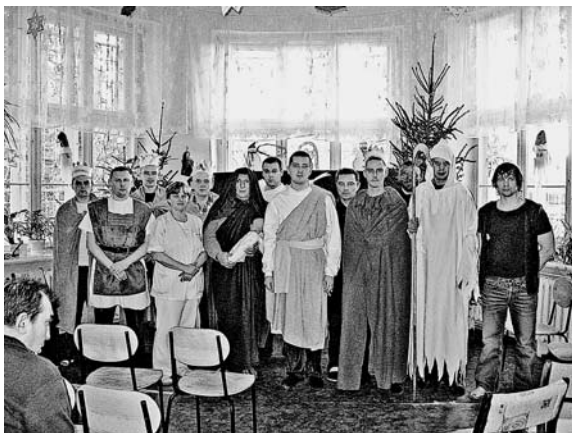
Rycina 2. Jasełka (wg [4])