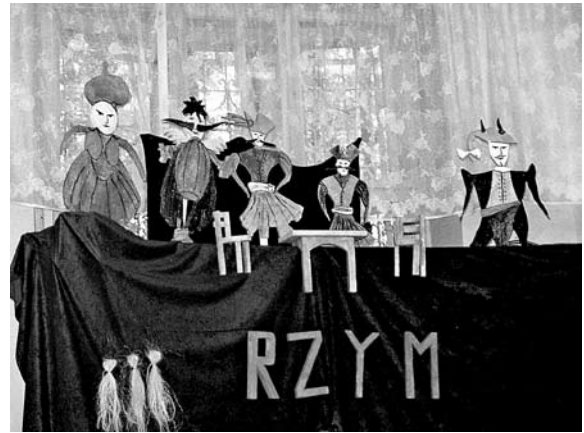
Rycina 5. Spektakl „Karczma Rzym” (wg [5])