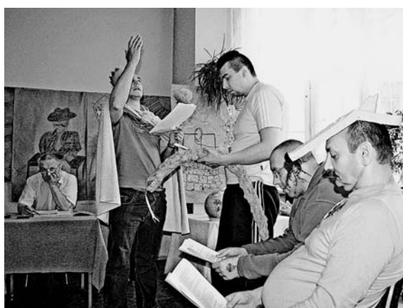
Rycina 9. Mały Książę (wg [6])