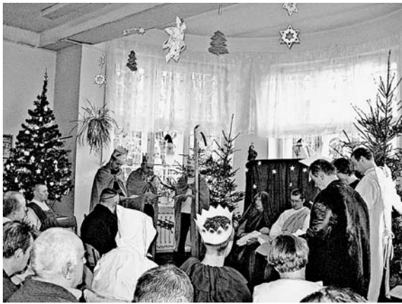
Rycina 1. Jasełka (wg [4])