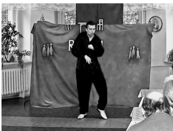
Rycina 7. Tancerze (wg [5])