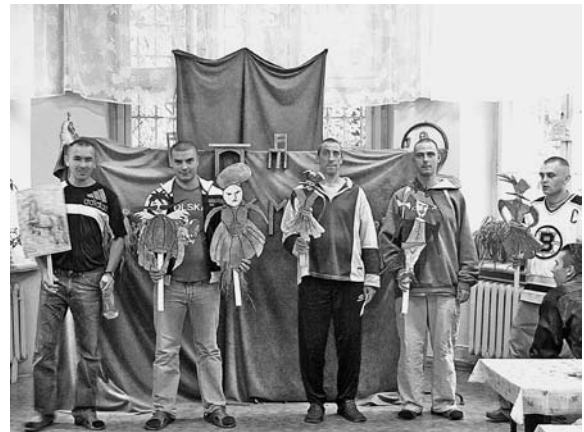
Rycina 4. Przedstawienie „Pani Twardowska” (wg [5])