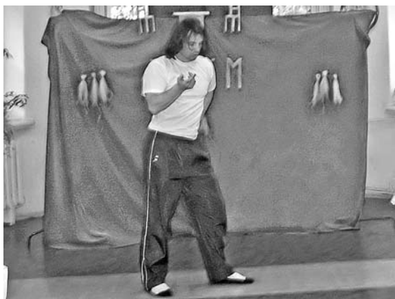
Rycina 6. Tancerze (wg [5])