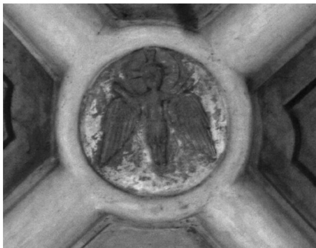
Ilustracja 1. Wąchock, Christos Angelos