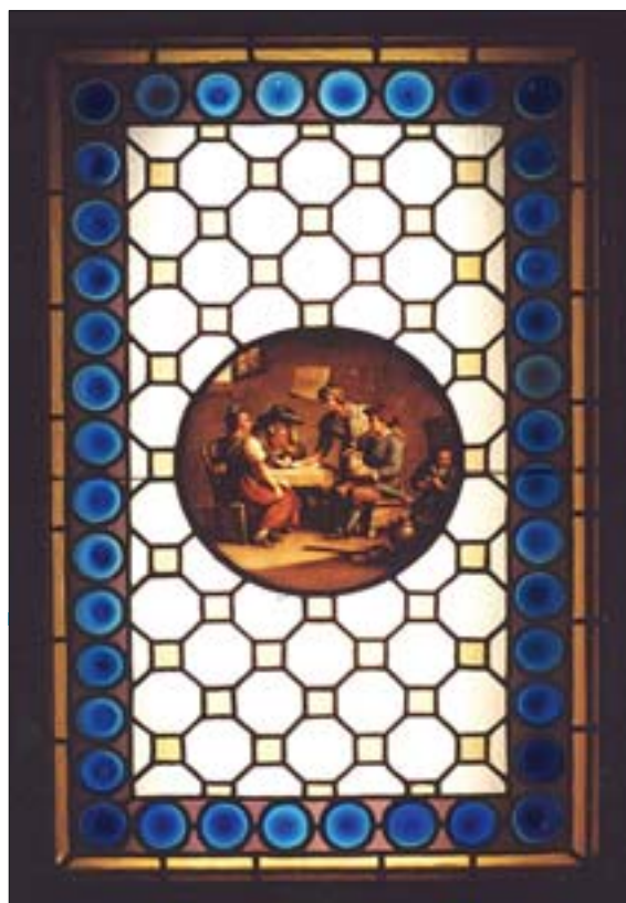
8. Witrażyk gabinetowy z medalionem malowanym emaliami, ze zbiorów Muzeum Architektury we Wrocławiu, 3. ćw. XIX w.

7. Neo-Baroque stained glass in the parish of St. Hyacinth in Kamień Śląski, executed in the workshop of Franz Mayer in Munich, early twentieth century.