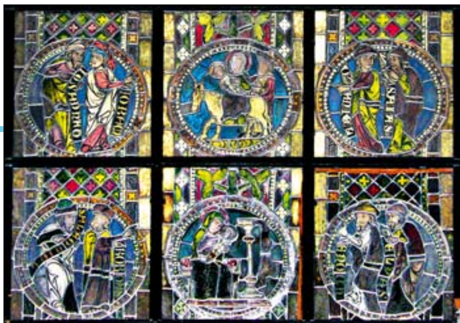
3. Fragment witraża w Katedrze Włocławskiej. 3. Fragment of stained glass in Włocławek cathedral.

To zadziwiające milczenie obejmuje również opisy historyczne wywieszane w kruchtach kościołów. Bywa nawet tak, że witraż o niewątpliwej wartości zabytkowej wstawiony jest w okno sali muzealnej, ale w przeciwieństwie do eksponatów prezentowanych w gablotach lub na ścianach nie jest w ogóle opatrzone żadną informacją. Nasuwa się wniosek, że w podstawowym kanonie wiedzy z zakresu historii sztuki tematyka witrażowa streszcza się do krótkich rozdziałów o średniowieczu oraz twórczości Wyspiańskiego i Mehoffera; poza tym niewiele wiadomo.