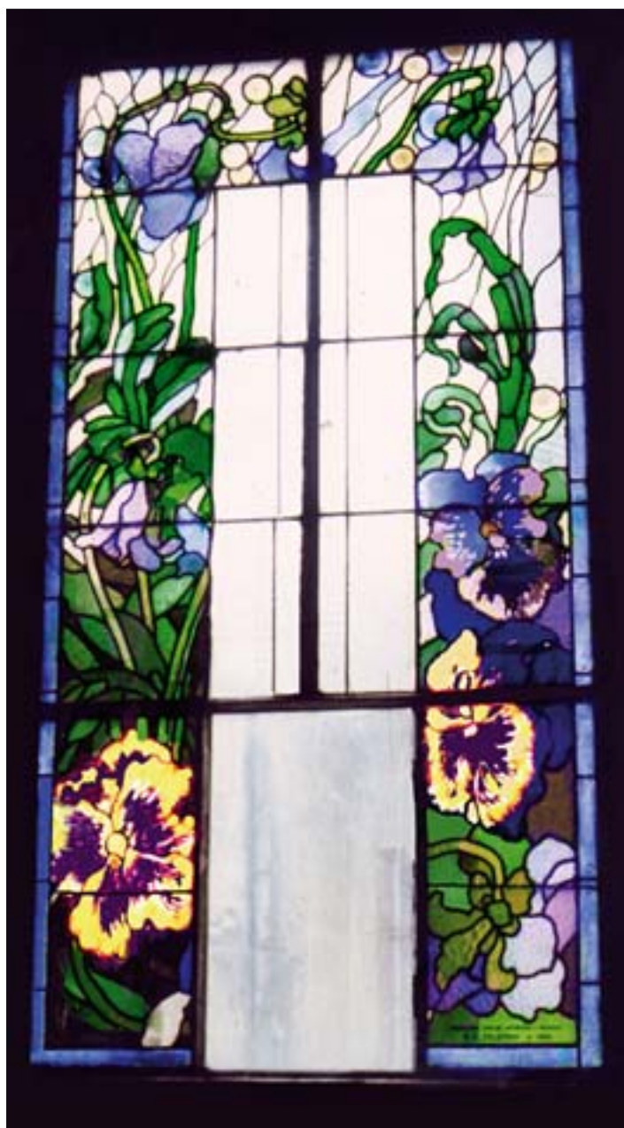
13. Witraż w klatce schodowej kamienicy przy ul. F. Straszewskiego 5 w Krakowie, wyk. w KZWiM, S.G. Żeleńskiego, 1910 r. 13. Stained glass in the staircase of a house in 5 F. Straszewskiego Street in Cracow, executed in the S.G. Żeleński Cracow Stained Glass and Mosaic Works, 1910.

Tego rodzaju dzieł nie należy jednak traktować jako witraży Wyspiańskiego, lecz jako interpretacje kartonów wg autorskich pomysłów różnych wykonawców. Należy z całą mocą podkreślić, że papierowy karton to w gruncie rzeczy zaledwie szkic projektu. Ostateczne dzieło powstaje w pracowni witrażowej z udziałem projektanta, nie da się bowiem na papierze jednoznacznie zaplanować efektów osiągniętych w szkle 21 . Szklą różni się nie tylko kolorem, lecz także stopniem przezroczystości, wewnętrzną strukturą i fakturą powierzchni. Dobór szkła w pracowni nie może się odbywać bez udziału lub choćby zgody projektanta. W przypadku witraży Wyspiańskiego sprawa jest tym bardziej skomplikowana, że jego kartony rysowane są szkicowo, a zatem odczytanie intencji artysty, co ma być linią ołowianego łączenia, a co linią rysunku na szkle, w wielu przypadkach nie jest możliwe. Z życiorysu Wyspiańskiego wynika, że sam mistrz ogromną wagę przywiązywał do warsztatowej fazy precyzowania projektu. Z jego listów znane są opisy sporów, jakie toczył z wykonawcami, którzy źle zinterpretowali jego zamysły twórcze.