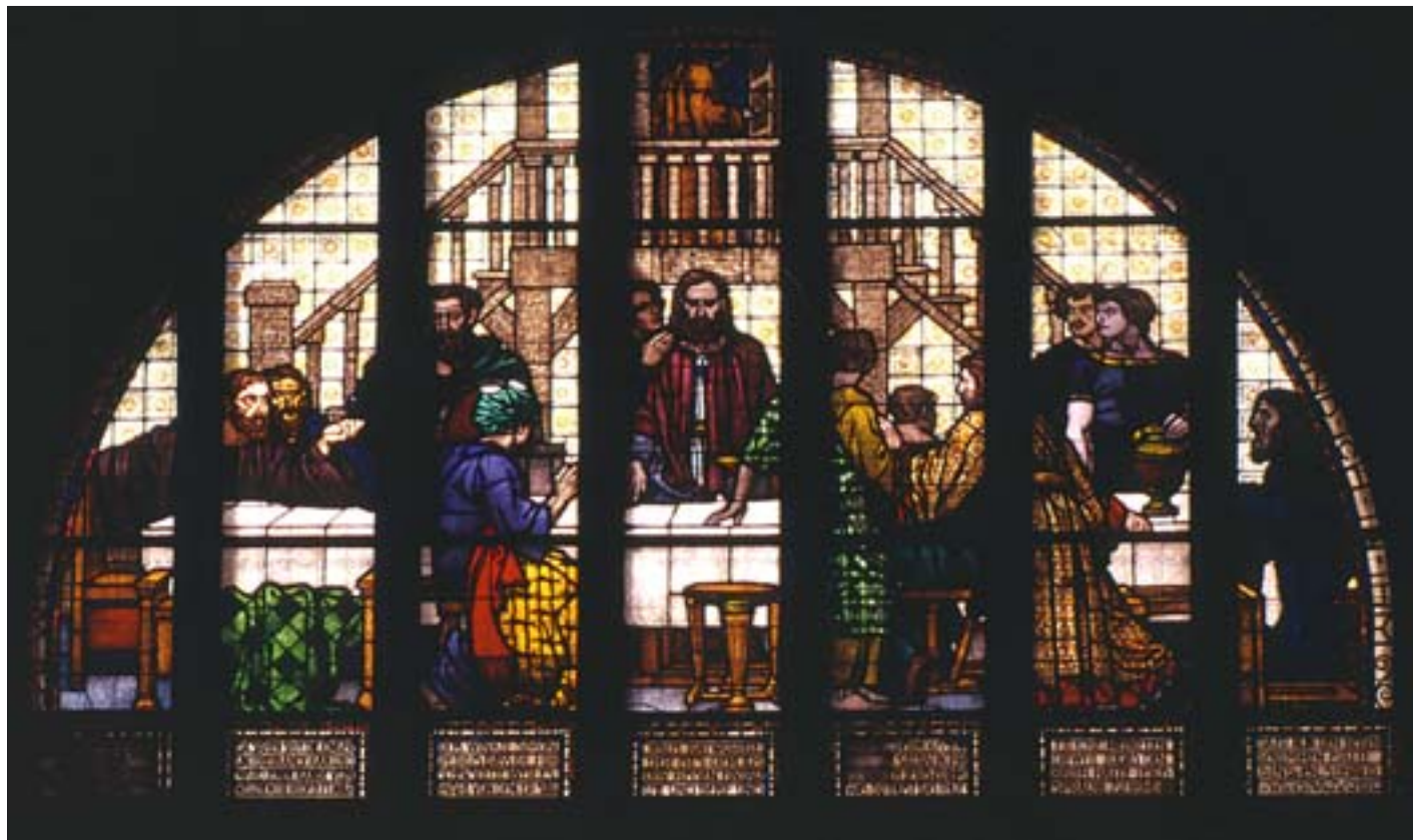
9. Ostatnia wieczerza , witraż w kościele ewangelickim w Prusicach na Dolnym Śląsku, wyk. w prac. Gottfrieda Heinersdorfa w Berlinie, 1911 r.

Rozwój techniki witrażowej polegał na rozszerzeniu palety kolorów i zwiększeniu różnorodności faktur szkła, ale prawdziwie nową jakością było wprowadzenie w XVII w. techniki malowania szkła kolorowymi emaliami. Poprzednio techniki malarzkie sprowadzały się do nanoszenia na taflę szklaną czarnej kreski oraz cieniowania z różnym natężeniem tym samym szarobrunatnym kolorem. Emalie pozwalały na rysunek kolorowy. Fascynacja nowością sprawiła, że witraże gabinetowe stały się w istocie rzeczy popisem malowania na szkle, a także wprowadzania rozmaitych nowych efektów możliwych