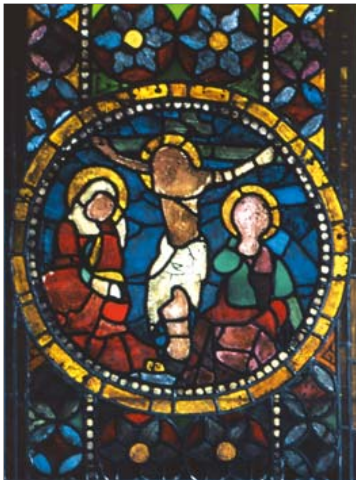
5. Ukrzyżowanie , kwatery średniowiecznego witraża z kościoła Mariackiego w Krakowie (okno pld. prezbiterium), 2. poł. XIV w. Brak pierwotnego rysunku na szkle.

Na skromną, jak już wspomniano, literaturę traktującą o dziedzictwie sztuki witrażowej w Polsce składają się książki, artykuły w czasopismach naukowych, rozdziały i wzmianki w książkach o bardziej ogólnej tematyce oraz katalogi wystaw i druki reklamowe. Dotychczas w języku polskim wydano zaledwie ok. 15 książek na ten temat, wliczając w to także publikacje o małej objętości. Niewątpliwie brakuje nam czegoś, co można by nazwać bazą danych o zabytkowych witrażach. Żadna placówka naukowa nie podjęła systematycznych prac nad tym tematem. Prowadzi je Stowarzyszenie Miłośników Witraży ARS VITREA POLONA, działająca od 1998 r. organizacja pozarządowa. Są to jednak działania podejmowane przez miłośników, zatem ich ramy wyznaczają osobiste zaangażowanie członków stowarzyszenia poświęcających tej sprawie wolny czas oraz budżet pochodzący ze składek członkowskich.