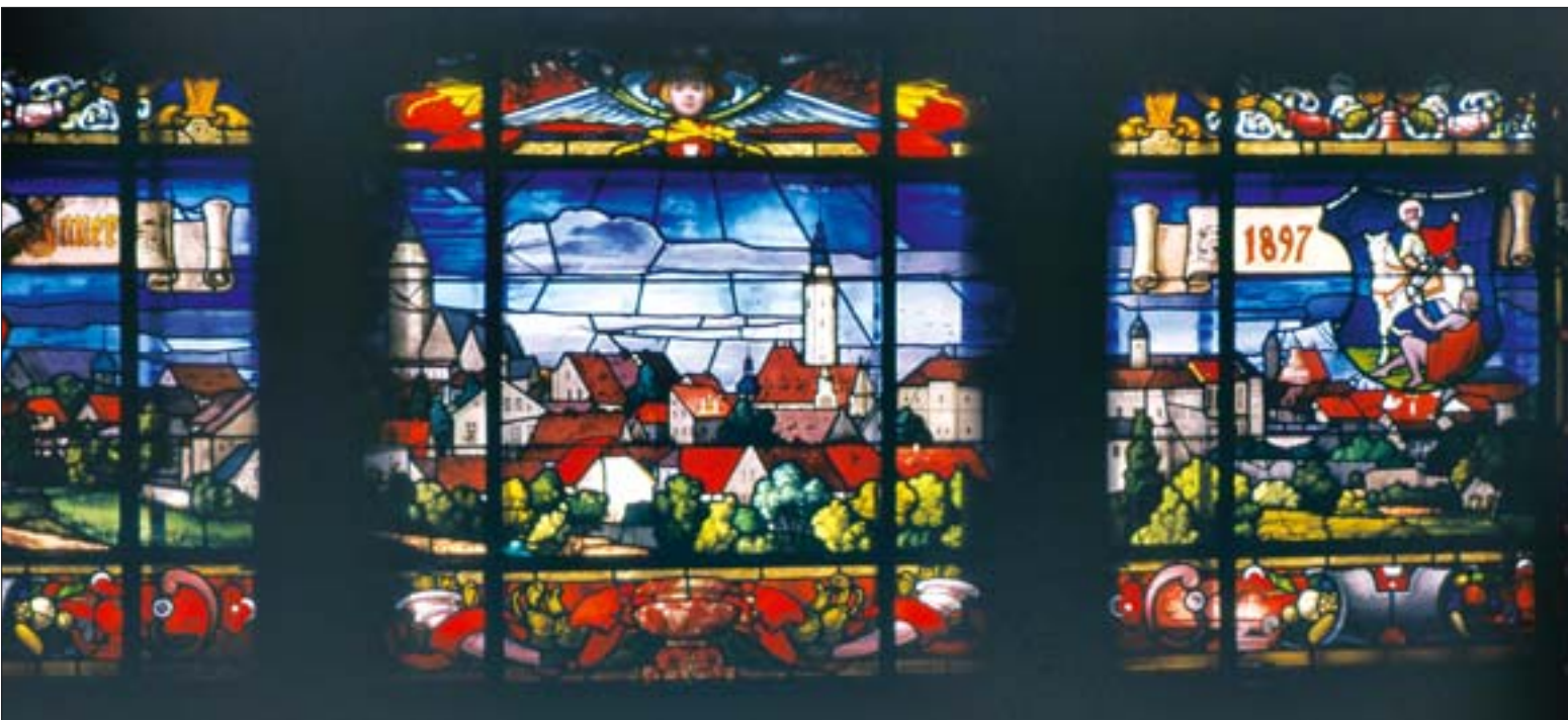
15. Fragment witraża w sali rajców ratusza w Jaworze, wyk. w Königlische Institut Glasmalerei w Berlinie, 1897 r.