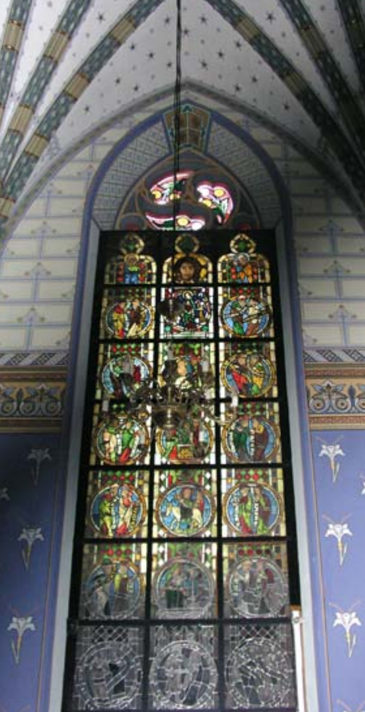
2. Średniowieczny witraż w Katedrze Włocławskiej, XIV w. 2. Mediaeval stained glass in Włocławek cathedral, fourteenth century.