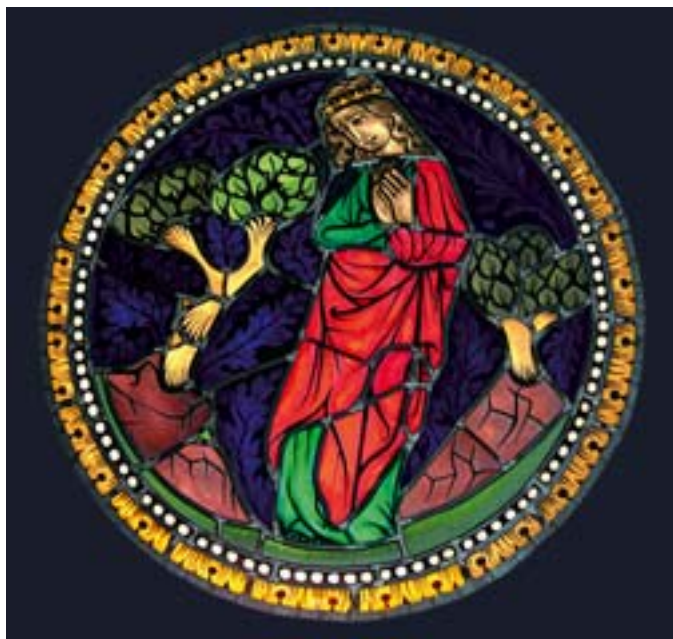
4. Oblubienica szukająca oblubieńca , kopia kwatery witraża z kościoła Mariackiego w Krakowie wyk. przez L. Heinego, konserwatora witraży mariackich, z rysunkiem na tle odtworzonym rysunkiem na szkle.

4. Bride Seeking the Bridegroom , copy of stained glass from the church of the Holy Virgin Mary in Cracow, executed by L. Heine, conservator of stained glass from this church, with a drawing against a background recreated on glass.