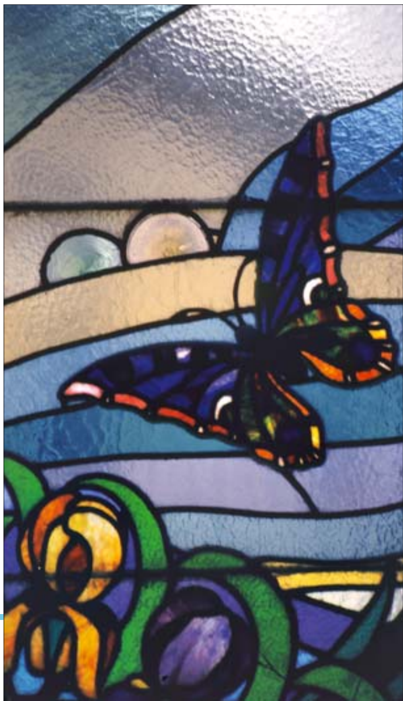
1. Fragment witraża w oknie klatki schodowej kamienicy przy ul. Długiej 53 w Krakowie, wyk. w Krakowskim Zakładzie Witrażów i Mozaiki S.G. Żeleńskiego, 1922. 1. Fragment of stained glass in the staircase of a house in 53 Długa Street in Cracow, executed in the S. G. Żeleński Cracow Stained Glass and Mosaic Works, 1922.

Ludzie zainteresowani sztuką, w tym także jej znawcy i koneserzy, którzy jednak nie zajmowali się bezpośrednio tematyką witrażową, sądzą zazwyczaj, że zasób wiedzy o tej i innych dziedzinach sztuki jest w sensie ilościowym podobny. Myślą, że wystarczy sięgnąć do literatury, aby znaleźć liczne opracowania monograficzne, katalogowe, przeglądowe, albumowe. Są to jednak nadzieje płonne, bo literatura w języku polskim o dziedzictwie polskiej sztuki witrażowej jest w rzeczywistości nad wyraz skromna. Podobnie ma się rzecz z informacjami o witrażach zawartymi w literaturze traktującej o obiektach architektonicznych. Obowiązuje pewien kanon ich opisu, w którym uwzględniane są liczne elementy architektury, detali i wyposażenia wnętrza, ale nie ma wzmianki o witrażach, nawet wtedy, gdy reprezentują wysoki poziom artystyczny, a podstawowe informacje o ich rodowodzie zapisane są wprost na nich.