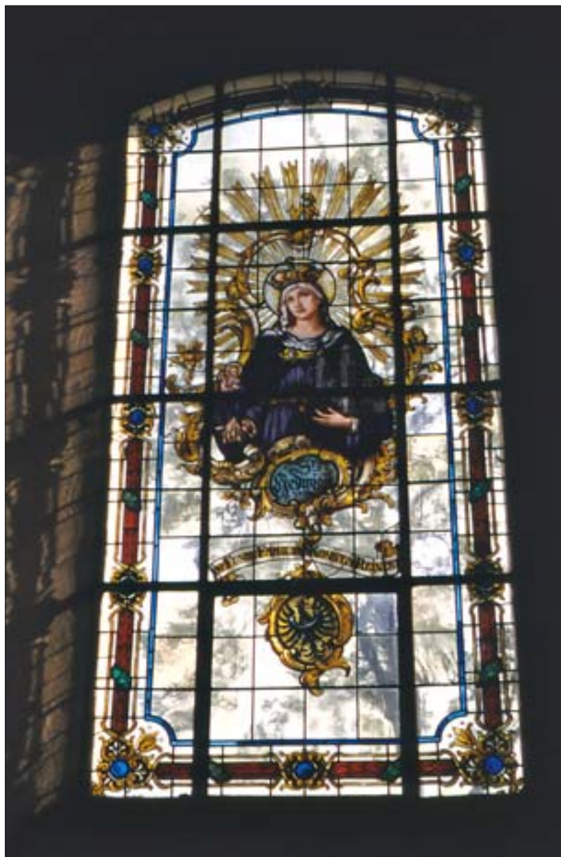
7. Neobarokowy witraż w kościele św. Jacka w Kamieniu Śląskim, wyk. w pracowni Franza Mayera w Monachium, pocz. XX wieku.

Poza tym mamy jeszcze pojedyncze kwatery w zbiorach Muzeum Architektury we Wrocławiu