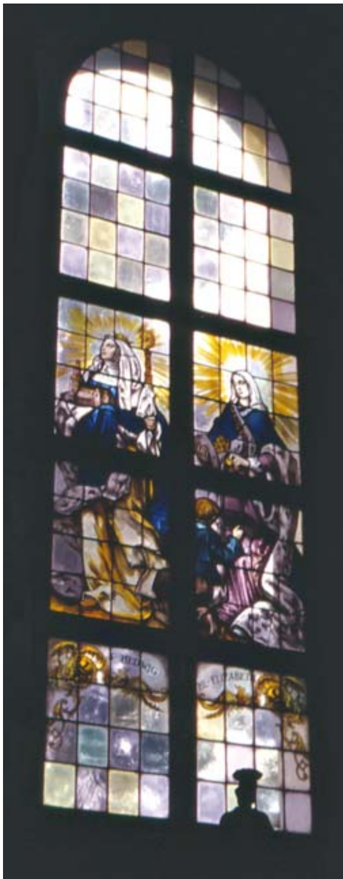
6. Neobarokowy witraż w kościele parafialnym w Mściwojowie na Dolnym Śląsku, wyk. w prac. Franza Mayera w Monachium, lata 30. XX w.

6. Neo-Baroque stained glass in the parish church in Mściwojów (Lower Silesia), executed in the workshop of Franz Mayer in Munich, 1930s.