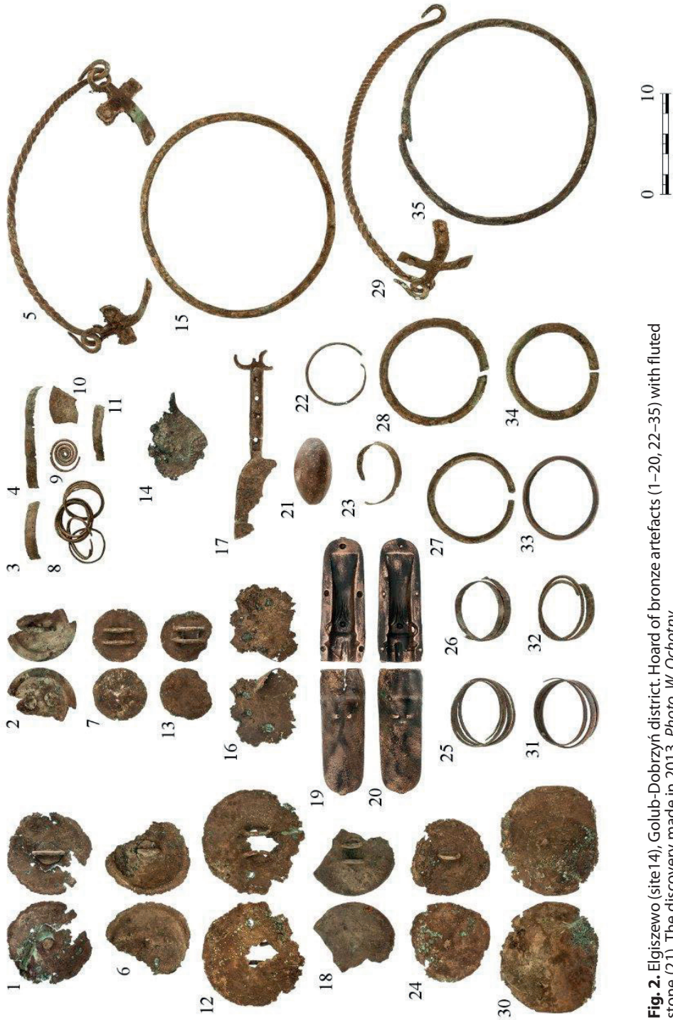
Fig. 2. Elgiszewo (site 14), Golub-Dobrzyń district. Hoard of bronze artefacts (1–20, 22–35) with fluted stone (21). The discovery made in 2013. Ryc. 2. Elgiszewo (stan. 14), pow. Golub-Dobrzyń. Skarb wyrobów z brązu (1–20, 22–35) wraz z kami- niem kanelurowanym (21). Odkrycie z 2013 r.