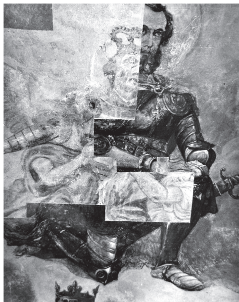
Fot. 3. Włodawa, sklepienie prezbiterium paulińskiego kościoła św. Ludwika Króla, usuwania XIX- i XX-wiecznych przemałowań podczas konserwacji w latach 1989-1991