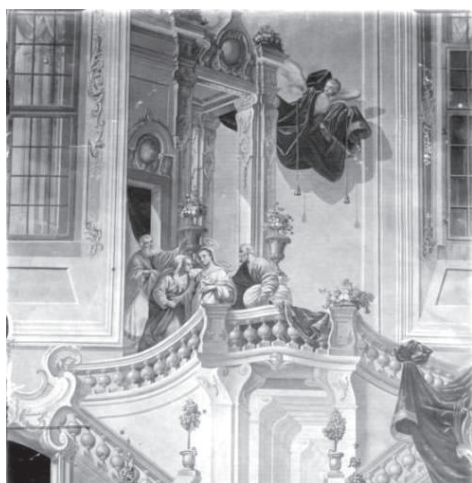
Fot. 13. Podkamień, prezbiterium dominikańskiego kościoła Wniebowzięcia Najświętszej Marii Panny i Podwyższenia Krzyża św., Stanisław Stroiński, architektura iluzjonistyczna (oprawa sceny Nawiedzenie św. Elżbiety ), fresk, 1776, fot. Kraków, Instytut Historii Sztuki UJ, sygn. OTPK34 Podkamień 009