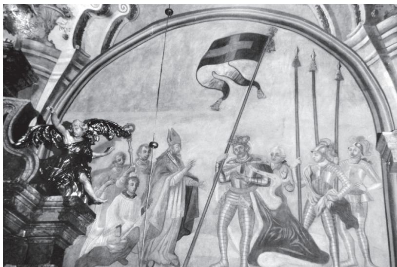
Fot. 2. Włodawa, ściana wsch. prezbiterium paulińskiego kościoła św. Ludwika Króla, zapewne Wojciech Dobrzeniewski, Biskupie pobłogosławienie św. Ludwika przed wyprawą krzyżową , fresk prawdziwy i suchy, wg Dokumentacja konserwatorska (Chełm, Delegatura Wojewódzkiego Urzędu Ochrony Zabytków)