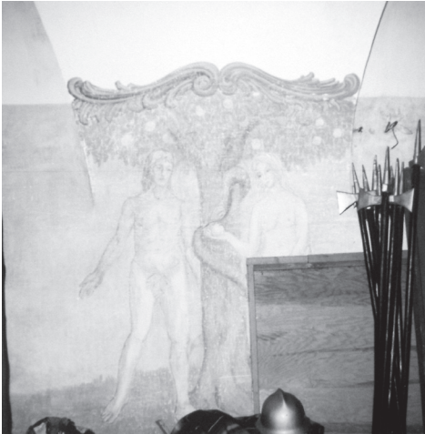
Fot. 29. Włodawa, piętro wsch. przybudówki przy prezbiterium paulińskiego kościoła św. Ludwika Króla, zapewne Antoni i Wojciech Dobrzeniewscy bądź sam Wojciech po śmierci brata, Adam i Ewa przy rajskim drzewie , fresk (?), niedługo przed lub niedługo po 1784 r. (?) (stan ok. 1990 r. obecnie zakryte)