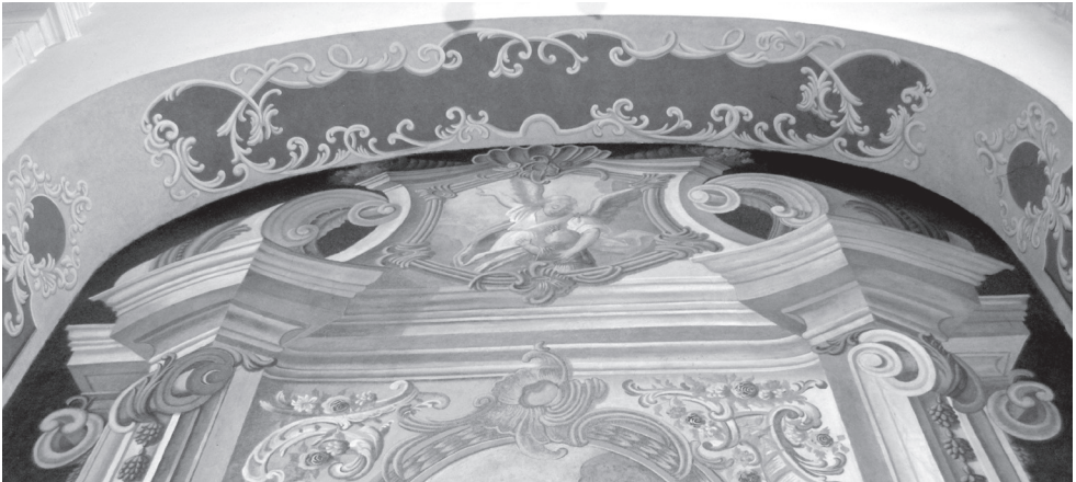
Fot. 33. Łęczeszyce, nawa paulińskiego kościoła św. Jana Chrzciciela, Antoni Dobrzeniewski i Antoni Bartosiewicz, ornamenty i zdobienia iluzjonistycznego ołtarza św. Tekli i podłucha wnęki, fresk, przed 1784 (może ok. 1765)