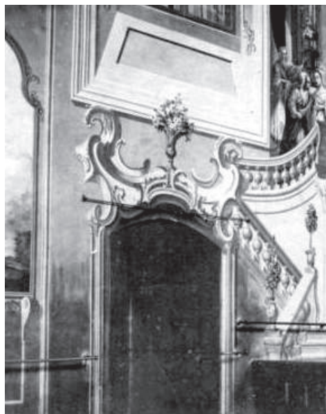
Fot. 17. Podkamień, prezbiterium dominikańskiego kościoła Wniebowzięcia Najświętszej Marii Panny i Podwyższenia Krzyża św., Stanisław Stroiński, architektura iluzjonistyczna, fresk, 1766, Kraków, fot. Instytut Historii Sztuki UJ, sygn. OTPK34 Podkamień 008