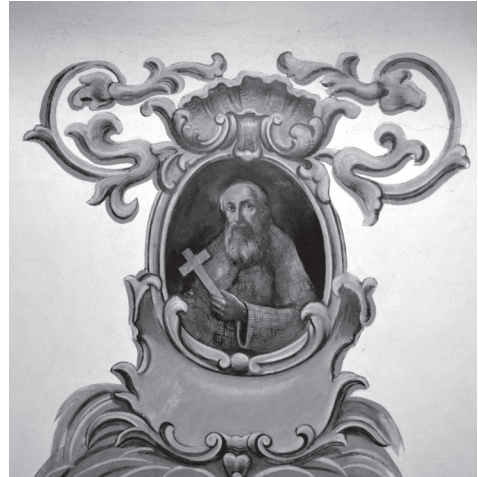
Fot. 30. Włodawa, parter wsch. przybudówki przy prezbiterium paulińskiego kościoła św. Ludwika Króla, zapewne Antoni i Wojciech Dobrzeniewscy bądź sam Wojciech po śmierci brata, Herb Paulinów z wizerunkiem św. Pawła Pustelnika. , fresk (?), niedługo przed lub niedługo po 1784 r. (?)