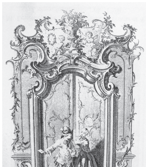
Fot. 19. Johann Esaias Nilson, rycina Porte d'un Salon , ok. 1756, wg A. Betlej, Inspiracje...