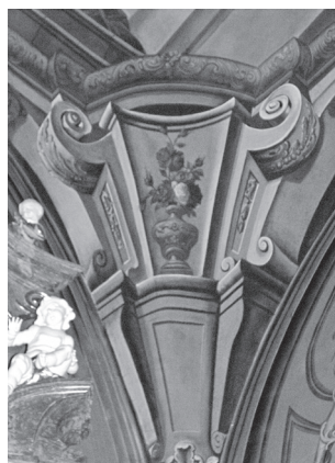
Fot. 23. Lwów, katedra łacińska, sklepienie kaplicy Matki Boskiej, Stanisław Stroiński lub/i jego współpracownicy, architektura iluzjonistyczna, fresk, ok. 1774, fot. M. Ludera