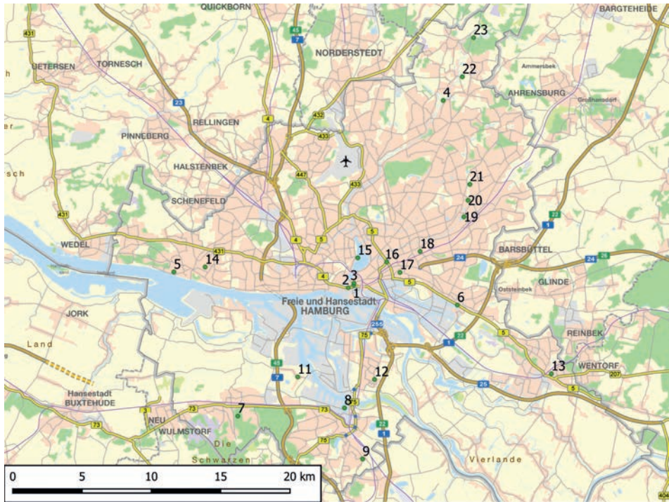
ABB. 1. Verbreitung der Burgen im Stadtgebiet von Hamburg: 1 – Hammaburg, 2 – Neue Burg, 3 – sog. Bischofsburg, 4 – Mellingburg, 5 – Süllberg, 6 – Spökelburg, 7 – Falkenberg, 8 – Horeburg, 9 – Rönneburg, 10 – Riepenburg, 11 – Moorburg, 12 – Wilhelmsburg, 13 – Bergedorf, 14 – Dockenhuden, 15 – angebliche Burg in der Alster, 16 – Hohenfelde, 17 – Hamm, 18 – Wandsbek, 19 – Tonndorf, 20 – Farmsen, 21 – Oldenfelde, 22 – Bergstedt, 23 – Wohldorf. Hergestellt von Archäologisches Museum Hamburg

RYC. 1. Rozmieszczenie grodów w obszarze miejskim Hamburga. 1 – Hammaburg, 2 – Neue Burg (nowy gród), 3 – tak zwany Bischofsburg (gród biskupi), 4 – Mellingburg, 5 – Süllberg, 6 – Spökelburg, 7 – Falkenberg, 8 – Horeburg, 9 – Rönneburg, 10 – Riepenburg, 11 – Moorburg, 12 – Wilhelmsburg, 13 – Bergedorf, 14 – Dockenhuden, 15 – domniemany zamek w Alster, 16 – Hohenfelde, 17 – Hamm, 18 – Wandsbek, 19 – Tonndorf, 20 – Farmsen, 21 – Oldenfelde, 22 – Bergstedt, 23 – Wohldorf. Oprac. Archäologisches Museum Hamburg