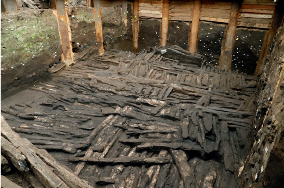
ABB. 4. Die hervorragende Erhaltung der Bauhölzer im Wall der Neuen Burg ist auf die Lagerung im immer feuchten Milieu der Flusssedimente zurückzuführen. Der Schnitt ist an dieser Stelle, von links nach rechts, 6 m breit.

RYC. 4. Doskonały stan zachowania drewna wału Neue Burg wynika z zalegania w zawsze wilgotnym środowisku osadów rzecznych. Przekięcie ma w tym miejscu 6 metrów szerokości (od lewej do prawej).