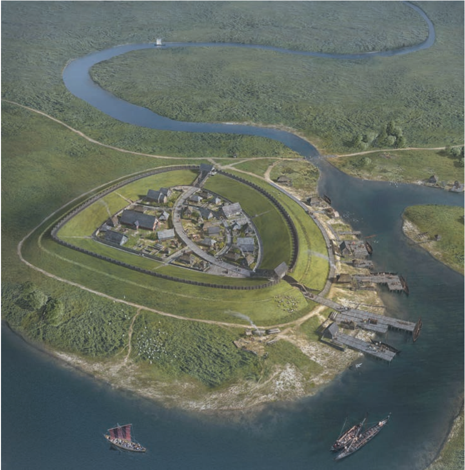
ABB. 3. Rekonstruktion der Neuen Burg um 1021. Blickrichtung nach Nordwest. Grafik: R. Warzecha für das Archäologische Museum Hamburg