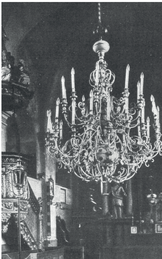
Fot. 3. Wnętrze kościoła Świętych Janów w Pile, 1905 r.