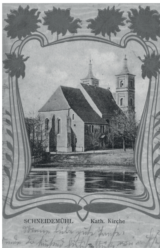
Fot. 2. Widok kościoła Świętych Janów w Pile na karcie pocztowej z 1905 r.