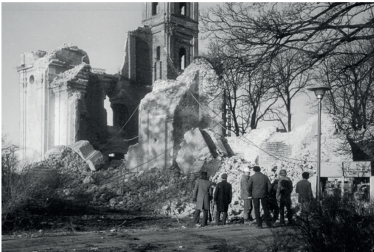
Fot. 7–8. Niszczenie pozostałości kościoła po wysadzeniu, grudzień 1975 r. [fot. Roman Zaranek]. Źródło: ze zbiorów Muzeum Okręgowego w Pile.