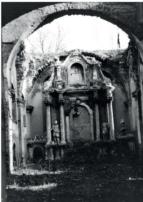
Fot. 6. Wnętrze wypalonego ołtarza głównego kościoła Świętych Janów, ok. 1950 r. [fot. Roman Zaranek]. Źródło: ze zbiorów Muzeum Okręgowego w Pile.

Źródło: ze zbiorów Muzeum Okręgowego w Pile.