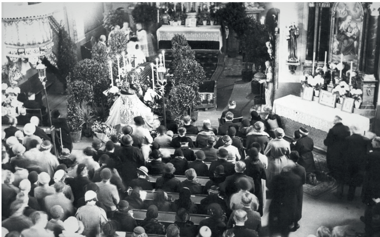
Fot. 5. Zdjęcie z Mszy Świętej w kościele Świętych Janów za duszę marszałka Józefa Piłsudskiego, maj 1935 r. [fot. Franciszek Witkowski].

Źródło: ze zbiorów Muzeum Okręgowego w Pile.