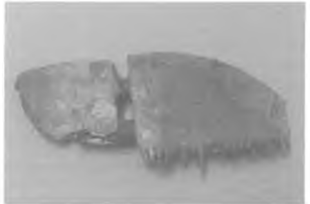
RYC. 2. Grzebień kościany z cmentarzyska w Białej koło Łodzi (okres rzymski).