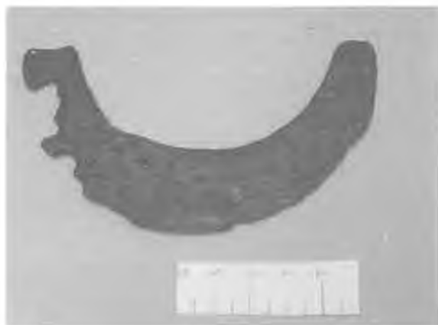
RYC. 4. Żelazna brzytwa półksiężycowata z cmentarzyska w Zadowicach koło Kalisza (wczesny okres rzymski — II wiek n. e.). (Ze zbiorów Muzeum Archeologicznego i Etnograficznego w Łodzi, udostępniono za zgodą Muzeum)

Brzytwy możemy podzielić na trzy grupy: trapezowate, półkoliste i półksiężycowate (ryc. 4). Brzytwy trapezowate charakteryzują się słabo łukowato wygiętym ostrzem i skośnie ściętymi końcami. Brązowe brzytwy trapezowate są znane z cmentarzysk typu łużyckiego z późnej epoki brązu. Brzytwy trapezowate ustąpiły miejsca okazom półkolistym i półksiężycowatym. Brzytwy półkoliste posiadają znacznie silniej wygięte ostrze, ucięte ich końce mają w przybliżeniu kierunek poziomy. U półksiężycowatych znalezisk końce nie są ścięte, lecz zwężają się stopniowo, tworząc ostrze mniej lub więcej wygięte ku górze 25 . Na terenie Polski również spotykamy