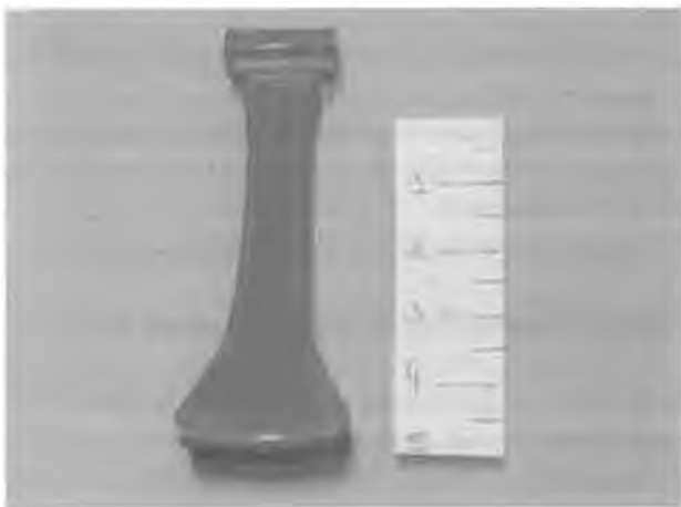
RYC. 5. Brązowe szczypczyki z cmentarzyska w Zadowicach koło Kalisza (późny okres lateński).

podokresu rzymskiego i z początku epoki żelaznej posiadają przesuwkę, która ułatwiała zwieranie się końców szczypiec.