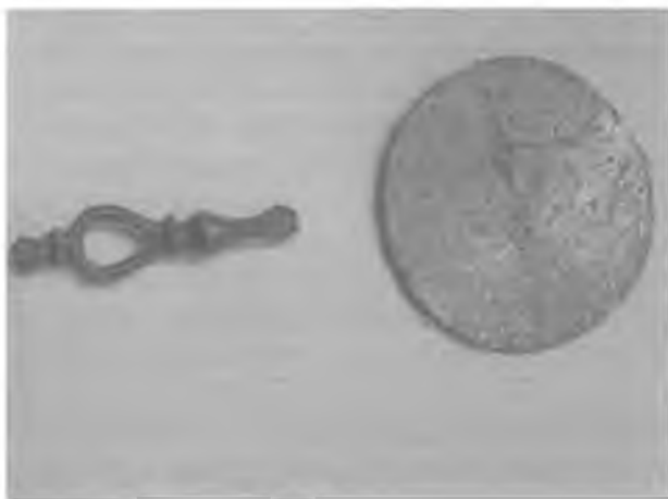
RYC. 6. Zwierciadełko brązowe i brązowe zakończenie uchwytu z cmentarzyska w Zadowicach koło Kalisza (późny okres przedrzymski I wiek p.n.e.).

cze należeli do wyższych warstw społecznych. Być może pełnili oni również jakieś nieznane nam dzisiaj funkcje w obrębie danej społeczności 42 .