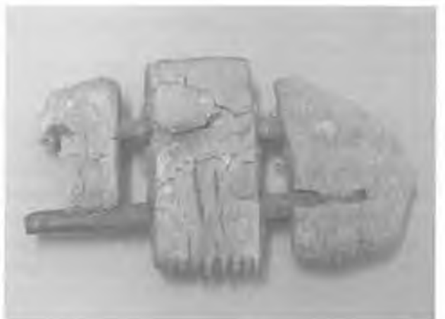
RYC. 3. Grzebień kościany z cmentarzyska w Białej koło Łodzi (okres rzymski).