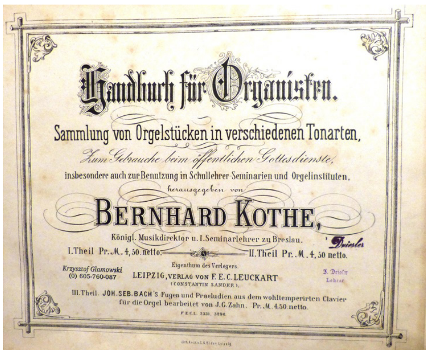
Fot. 2. Strona tytułowa zbioru

Handbuch jest praktycznym zbiorem przeznaczonym przede wszystkim do użytku liturgicznego, ale wykorzystywanym także jako materiał dydaktyczny. Pełny tytuł publikacji brzmi: Handbuch für Organisten. Sammlung von Orgelstücken in allen Tonarten zum Gebrauche beim öffentlichen Gottesdienste, insbesondere auch zur Benutzung in Schullehrer-Seminaren und Präparanden-Anstalten (Podręcznik dla organistów. Zbiór utworów organowych we wszystkich tonacjach do wykorzystania podczas nabożeństw, szczególnie zaś w seminariach nauczycielskich i preparandach). Przez współczesnych autorowi oceniany był znacznie wyżej niż wcześniejszy i równie popularny zbiór Kothe'go zatytułowany Orgelstücke in den alten Kirchentonarten 11 . Warto przytoczyć fragment recenzji wybitnego cecyliarzysty ks. Franza Xavera Haberla (1840–1910):