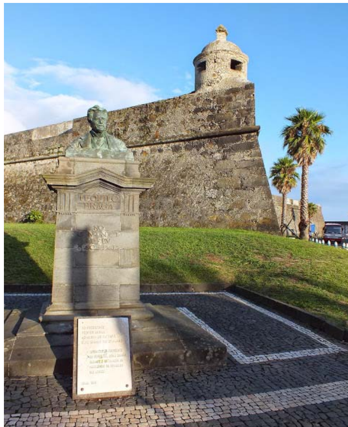
Fot. 7. Ponta Delgada - twierdza morska, która broniła dostępu do wybrzeży wyspy Sao Miguel.

Program Erasmus sprzyja wymianie doświadczeń i zdobywaniu nowych kompetencji. Choć powszechnie uważa się, iż jest on kierowany głównie do studentów to także pracownicy jednostek naukowych mogą brać w nim aktywny udział. Doświadczenia pracowników Biblioteki Głównej potwierdzają fakt, że warto uczestniczyć w tego typu wyjazdach szkoleniowych. Oczywiście każdy taki wyjazd powoduje też wzajemne nawiązanie relacji, dzięki czemu nie tylko pracownicy biblioteki mogą wyjeżdżać do innych krajów, ale również zagraniczni bibliotekarze często odwiedzają naszą Uczelnię.