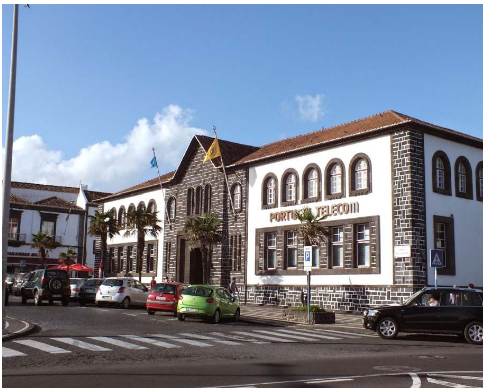
Fot. 3. Ponta Delgada - charakterystyczna zabudowa wysp azorskich: białe budynki z elementami ciemnych kamieni wulkanicznych.

Do prawdziwych atrakcji kulturalnych na Sao Miguel należy niewątpliwie wizyta w pięknym pałacu Conceicao oraz w muzeum Carlosa Machado. Wrzące gorące źródła w ogrodzie Vale de Furnas, połykające na niebiesko i zielono jeziora (Lagoa Azul i Lagoa Verde) w malowniczej miejscowości Sete Cidades, olbrzymie pola uprawne kukurydzy, tytoniu, ananasów i wina, a także - jedyna europejska - plantacja herbaty, ogniste jezioro Lagoa do Fogo w górach za Serra de Agua de Pau, lecząca woda w jeziorze ogrodu botanicznego Terra Nostra - to tylko wybrane atrakcje wyspy.