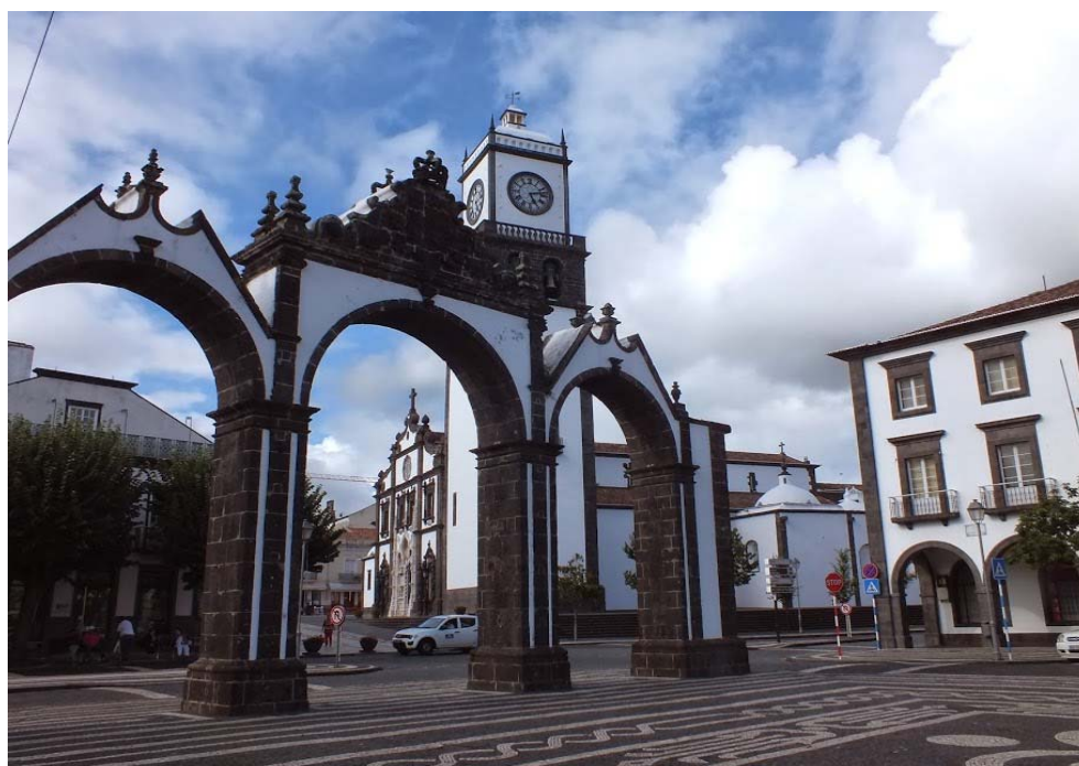
Fot. 1. Ponta Delgada - główny plac miasta z charakterystyczną bramą.

Pracownicy Biblioteki mieli możliwość odbycia stażu zagranicznego w bibliotece Uniwersytetu na Wyspach Azorskich w Portugalii. Zasadniczym celem dziesięciodniowej wizyty było porównanie działalności systemu informacyjno-bibliotecznego pomiędzy instytucjami partnerskimi, choć nie brakło również możliwości konfrontacji realiów pracy i życia na tym odległym skrawku Europy z tym, czego doświadczyć można na co dzień w Polsce.