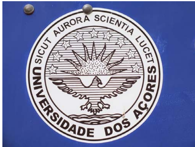
Fot. 4. Logotyp Universidade dos Açores.

Universidade dos Açores została założona w 1976 roku. W początkowym okresie swojej działalności uczelnia posiadała tylko budynek główny na wyspie San Miguel. Aktualnie w skład struktury Uniwersytetu Azorskiego wchodzi 3 kampusy rozmieszczone na poszczególnych wyspach (São Miguel, Terceira i Faial) – mieści się na nich 11 wydziałów i 2 szkoły pielęgniarskie. Uczelnia kształci około 6000 studentów, zatrudnia 490 wykładowców i około 250 pracowników administracyjnych.