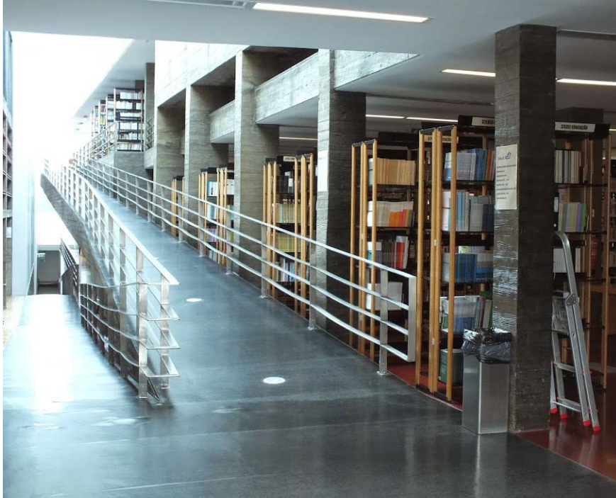
Fot. 6. Wnętrze biblioteki centralnej Uniwersytetu Azorskiego.

Budynek biblioteki z zewnątrz sprawia wrażenie dużego bunkra. Nowoczesna konstrukcja oddana do użytku kilka lat temu została zaprojektowana z myślą o pełnieniu funkcji bibliotecznej, jednakże zarówno użytkownicy, jak i pracownicy biblioteki wskazują sporo mankamentów takich nowatorskich rozwiązań.