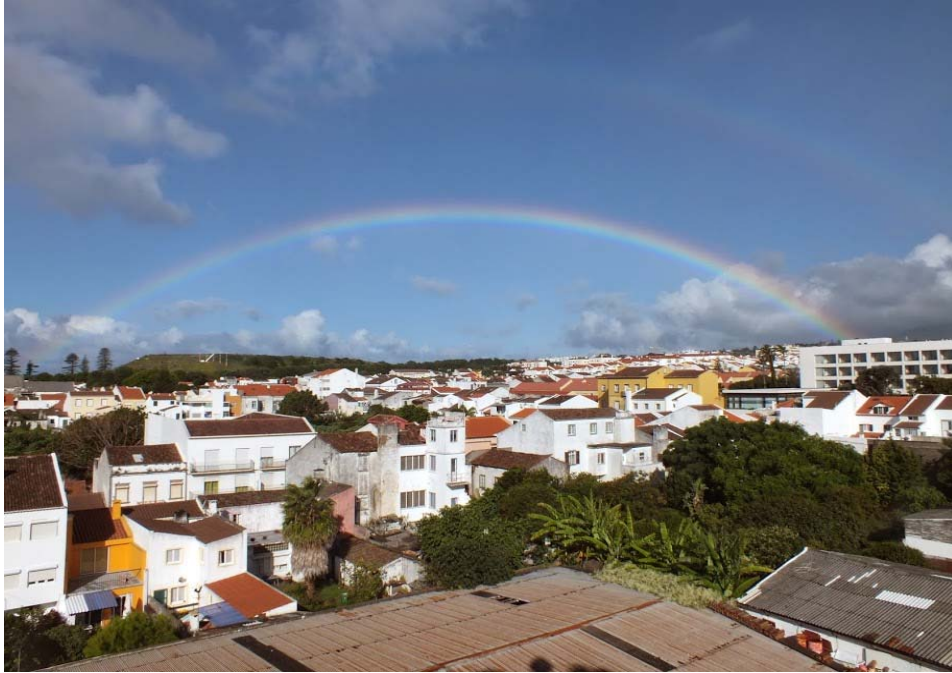
Fot. 8. Azory - nieodłączny element pogody, czyli codzienne deszcze i codzienna tęcza...