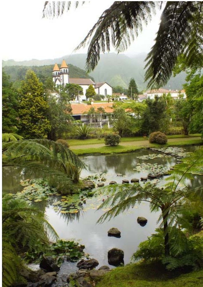
Fot. 2. Azory - zielone wyspy.

Pracownicy biblioteki odwiedzili największą z wysp archipelagu azorskiego, Sao Miguel, na której znajduje się największe miasto Azorów, a zarazem stolica regionu – Ponta Delgada. Sao Miguel określana jest przez wielu mianem „zielonego raj” i w pełni zasługuje na ten tytuł.