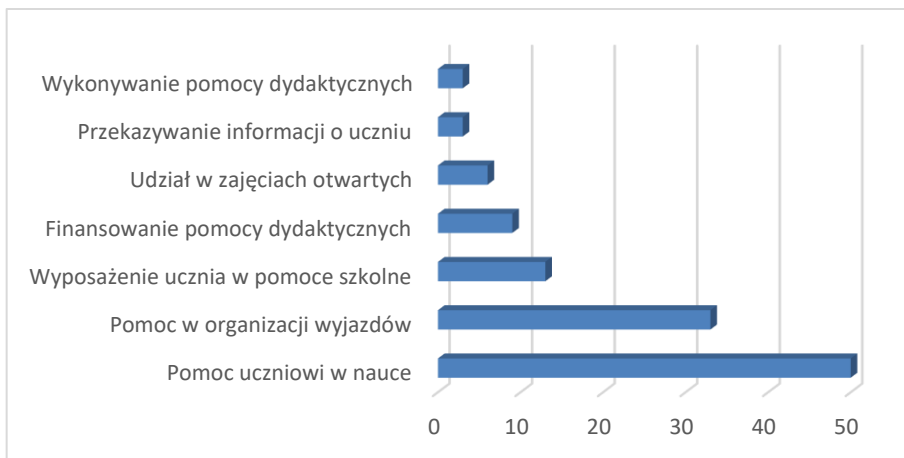
Rysunek 1. Praktykowane przez rodziców formy wsparcia nauczycieli w realizacji zadań dydaktycznych

Rodzice wspomagają także nauczycieli w realizacji licznych zadań dydaktycznych. Na rysunku 1 zaprezentowano wymieniane przez nauczycieli formy owej współpracy.