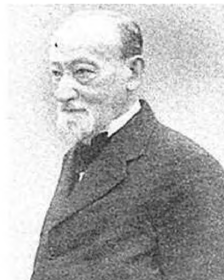
Ryc. 13. Prof. Adolf Wallenberg (1862-1949).

Prof. dr med. Wallenberg Adolf (Ryc. 13). Wybitny niemiecki internista i neurolog żydowskiego pochodzenia. Urodził się 10 listopada 1862 r. w Starogardzie