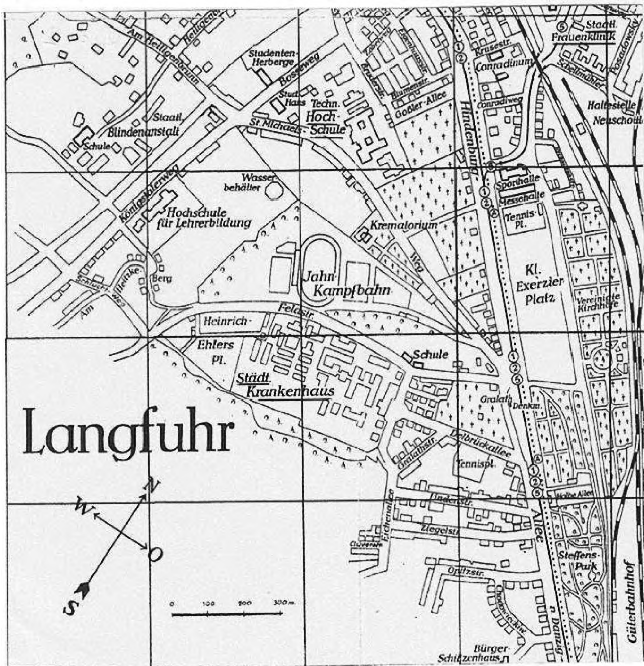
Ryc. 1. Lokalizacja Szpitala Miejskiego, Wyższej Szkoły Technicznej i Kliniki Chorób Kobięcych we Wrzeszczu, mapa z 1935 r.

budowano nowe wodociągi i kanalizację, unowocześniano szpitale. Proces ten nie ominął także Gdańska. W 1900 r. liczba jego mieszkańców wynosiła ponad 140.000 a dziesięć lat później ca. 171.000. Według Encyklopedii Gdańskiej [1] Polacy stanowili w 1914 r. 3,5 % ogółu stałych mieszkańców miasta. Otwarcie w 1904 r. we Wrzeszczu przez cesarza Wilhelma II Wyższej Szkoły Technicznej (Technische Hochschule Danzig) przy Goßler Allee (obecnie ul. Narutowicza), w 1911 r. Nowego Szpitala Miejskiego przy Delbrückallee (obecnie ul. Dębinki) (Ryc. 1) oraz wybudowanie w latach 1910-1912 Państwowej Kliniki Położnictwa i Chorób Kobie-