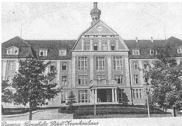
Ryc. 2. Budynek frontowy Szpitala Miejskiego w Gdańsku-Wrzeszczu. Lata 30. XX wieku. Karta pocztowa.

się jeszcze w 1907 r. Oficjalne otwarcie szpitala nastąpiło w dniu 19 kwietnia 1911 r. (Ryc. 2). Koszty budowy szpitala pochłonęły sumę 5.211.550 marek. W rezultacie powstał nowoczesny, 700 łóżkowy [10] Szpital Miejski (Szarszewski [9] podaje, że do 1914 dysponował on 496 łóżkami), zatrudniający początkowo (1912) tylko 15 lekarzy. Nowy szpital składał się z 16 pawilonowych budynków krytych płaskim dachem (Ryc. 3), gdzie mieściły się pierwotnie tylko oddziały chorób wewnętrznych (ordynator prof. Adolf Wallenberg) i chirurgii (ordynator prof. Arthur Barth). W 1912 r. rozpoczął funkcjonowanie Zakład Patologii z prosektorem (prof. Hermann Stahr), jednym lekarzem asystentem i kilkoma laborantkami. W obrębie szpitala zlokalizowane były administracja, prosektorium, blok operacyjny, łaźnia, budynki gospodarcze, kotłownia, hotel dla pielęgniarek oraz inne pomieszczenia dla lekarzy i personelu. Pokoje dla chorych były jedno- dwu- i wielo-łóżkowe, z podziałem na klasy I, II i III, wg. zamożności chorych. Pierwszych 181 internistycznych pacjentów