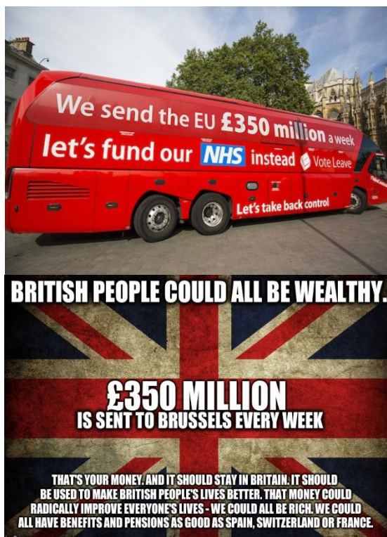
Fot. 1. Autobus z hasłem stworzonym na rzecz kampanii zachęcającej Brytyjczyków do wystąpienia z UE oraz mem zawierający to samo hasło ze wzmocnionym motywacyjnym przekazem

Spółeczeństwo Wielkiej Brytanii w zorganizowanym referendum postanowiło opuścić Unię Europejską, a wkrótce po tym zwolennicy tego rozstania zaczęli wycofywać się ze swoich obietnic i dewaluować nośne hasła, w tym osławione „360 mln”. W odwecie powstał kolejny nośny mem, niestety służący już jedynie jako komentarz do w/w wydarzeń.