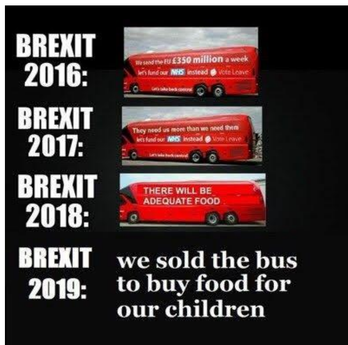
Fot. 2. Mem, który pojawił się na portalach społecznościowych po kolejnych nieudanych negocjacjach dotyczących wyjścia Wielkiej Brytanii z UE

Memy, dzięki swojemu mariażowi obrazu z krótkim tekstem są najbardziej nośnym narzędziem propagandy, ponieważ powtarzając za Richardem Dawkinsem rozprzestrzeniają się jak wirus, ewoluując i dostosowując się do otoczenia, „atakując” przy tym jak największą liczbę użytkowników. Niezwykle wynika z danych z Twittera, że rosyjskie i irańskie trolle internetowe wysłały ponad 10 milionów tweetów, aby szerzyć dezinformację i niezgodę na Zachodzie.