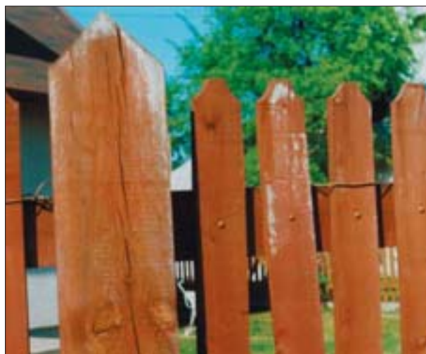
14. Drewniane ogrodzenie z miejscami oskrobanymi przez osy z preparatu dekoracyjno-ochronnego.

Zagwoździk fiołkowy (il. 6, 7 i 8), oprócz „korowania” drewna, narusza swoimi kolebkami poczwarowymi w kształcie haków jego wierzchnie warstwy do głębokości ok. 4 cm. Również niektóre inne gatunki z rodziny kózkowatych mogą powodować podobne uszkodzenia ściętego, nieokorowanego drewna, zwłaszcza liściastego. Stukacz świerkowiec (il. 9 i 10), którego larwy uszkadzają drewno jedynie do głębokości 5 mm, może być uciążliwy także w kolekcjach muzealnych, w których zgromadzono wyrzynki nieokorowanych pni drzew iglastych.