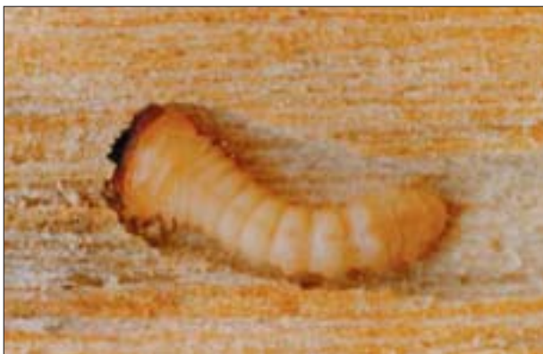
1. Larwa wykarczaka sosnowca ( Arhopalus rusticus L.) w żerowisku. Wszystkie ilustracje A. Krajewski.

Taki podział ułatwia klasyfikację owadów jako szkodników drewna i usystematyzowanie zabiegów ochronnych. Nie oznacza jednak, że każdy gatunek owada, który wykorzystuje drewno dla zaspokojenia życiowych potrzeb, będzie można zakwalifikować wyłącznie do jednej z trzech, nakreślonych ramowo, grup. Niektóre gatunki owadów należą bowiem do dwóch lub nawet trzech kategorii. Miazgowce np. mogą całkowicie zniszczyć biel dębu, zarówno suche drewno martwic żywych drzew, okrągły i przetarty surowiec na składowiskach, jak i półprodukty, wyroby meblarskie czy takie elementy wystroju wnętrz, jak podłogi i boazerie. Z kolei spuszczał pospolicity,