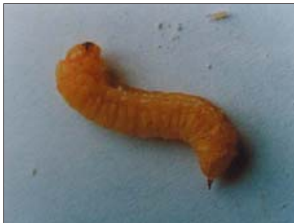
3. Larwa trzpiennika sosnowca ( Sirex noctilio Fabr.) wydobyta z drewna.

Zagrożenia ze strony tych owadów wynikają prze- de wszystkim z ich dużego przystosowania do śro- dowiska życia człowieka. Cechuje je zróżnicowana tolerancja na obniżoną wilgotność powietrza i dreb- na, ale generalnie jest ona u nich większa niż u innych owadów leśnych. Zasadlają powietrznosuche dreb- no, tj. składowane poza budynkami w zadaszeniu, o wilgotności zawartej w granicach 12-20%. W pol- skich warunkach środowiskowych przy tego typu składowaniu nie można uzyskać wilgotności mniej- szej niż 12%. Niemożliwe jest zatem uniknięcie szkód powodowanych przez gatunki owadów nale- żące do tej grupy, stosując zasady profilaktyki bu- dowlanej zmierzające do eliminowania zawilgocenia drewna, co daje dobre rezultaty w przypadku owadów zaliczanych do grup II i III. Szkodniki z grupy I atakują czasem nawet drewno o wilgotności