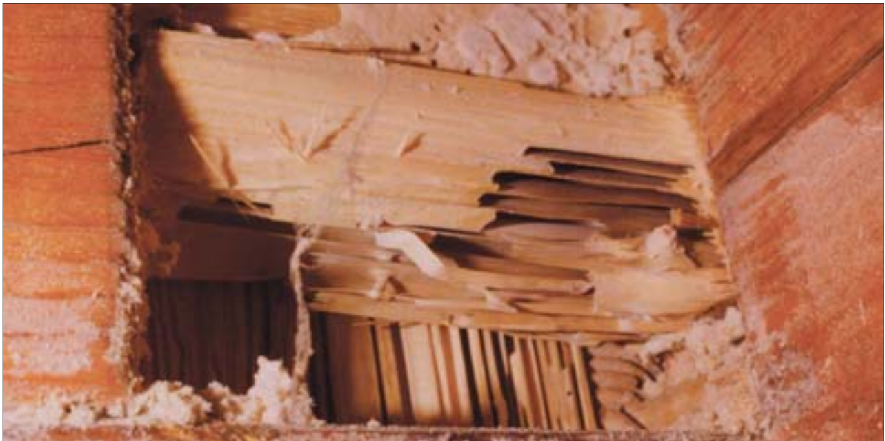
12. Uszkodzenia belek ściennych za szalunkiem spowodowane przez mrówki. 12. Damage caused by ants to wall beams behind boarding.