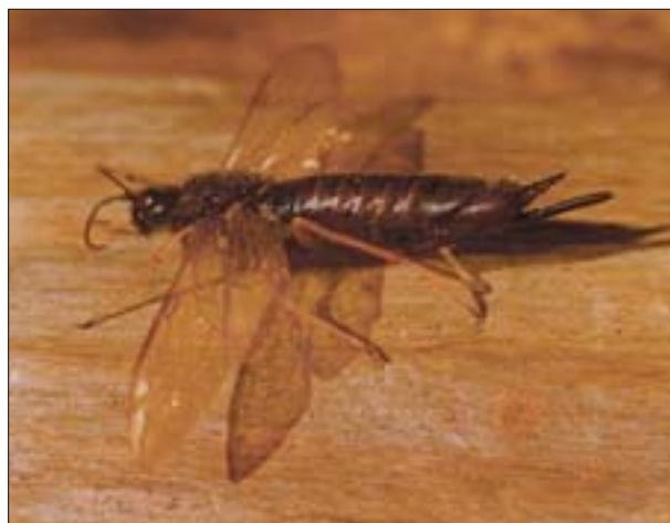
4. Postać doskonała trzpiennika sosnowca ( Sirex noctilio Fabr.) – samica.

3. Larva of Sirex noctilio Fabr. extracted from timber.