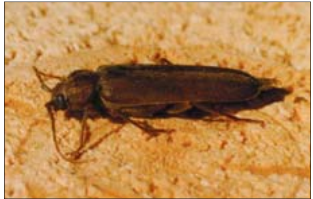
2. Chrząszcz wykarczaka sosnowca ( Arhopalus rusticus L.).

1. Larva of Arhopalus rusticus L. in feeding ground. All illustrations: A. Krajewski.