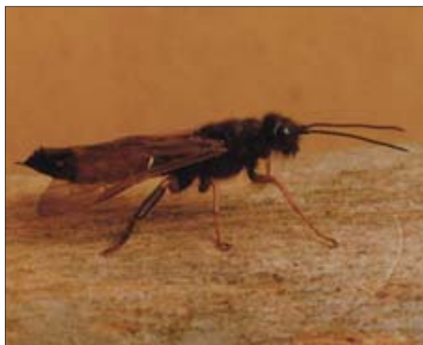
5. Postać doskonała trzpiennika sosnowca ( Sirex noctilio Fabr.) – samiec.

4. Perfect form of Sirex noctilio Fabr. – female.