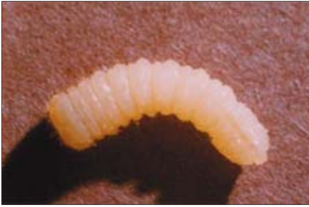
6. Larwa zagwoździka fioletowego ( Callidium violaceum L.) wydobyta z drewna.

6. Larva of Callidium violaceum L. extracted from timber.