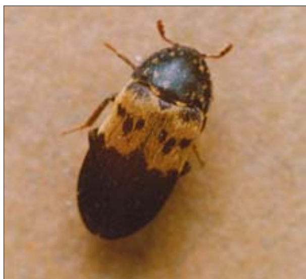
11. Chrząszcz skórnika słonińca ( Dermestes lardarius Kug.).

Wymienione zostały tylko gatunki występujące w całym kraju, pominięto natomiast występujące regionalnie lub rzadko w szerszej skali. Ich znaczenie gospodarcze jest bardzo różne, ale ogranicza się zasadniczo do zawilgoconych części obiektów architektury. Owady te powodują szkody przede wszystkim w zawilgoconych fragmentach obiektów architektury, w nieprawidłowo posadowionych budynkach, co – zwłaszcza w przypadku zabytkowych, drewnianych kościołów – jest częstym zjawiskiem w Polsce. Dotyczy to także innych obiektów, np. baraków obozowych w Brzezince 14 . Zasiadając zawilgocone drewno, dotknięte