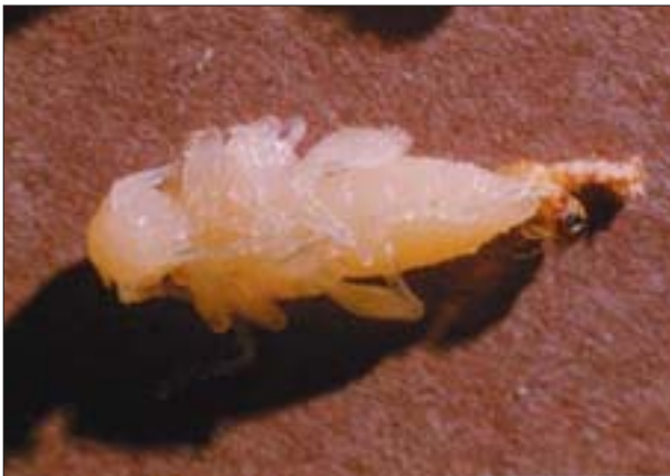
7. Poczwarzka zagwoździka fioletowego ( Callidium violaceum L.) wydobyta z drewna.

6. Larva of Callidium violaceum L. extracted from timber.