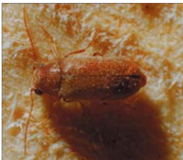
10. Chrząszcz stukacza świerkowca ( Ernobius mollis L.).

9. Larva of Ernobius mollis L. in feeding ground.