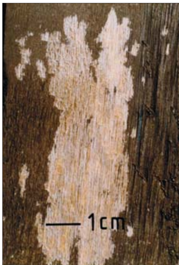
15. Miejsca na drewnie ogrodzenia oskrobane przez osy z preparatu dekoracyjno-ochronnego.

Nie tylko gatunki opisane w ramach wyodrębnionych grup mogą powodować szkody wyrobionego drewna. W ostatnich latach odnotowano liczne przypadki oskrobywania przez bliżej nieokreślone gatunki os drewna zabezpieczonego niektórymi preparatami dekoracyjno-ochronnymi 21 . O ile na surowym drewnie miejsca takie pozostają praktycznie niezauważalne, to w przypadku powierzchni pokrytej barwnymi preparatami ujawniają się w postaci brzydkich, lizajawatych plam (il. 14 i 15). Z tego względu trudno zakwalifikować osy jako szkodniki techniczne drewna. Jednak ich działalność, oprócz niszczenia powierzchni drewna, otwiera drogę zarodnikom grzybów oraz umożliwia składanie jaj typowo ksylofagicznym gatunkom owadów. W przypadku drewna dóbr kultury preparaty ochronno-dekoracyjne mają ograniczone zastosowanie. Ich użycie sprowadza się