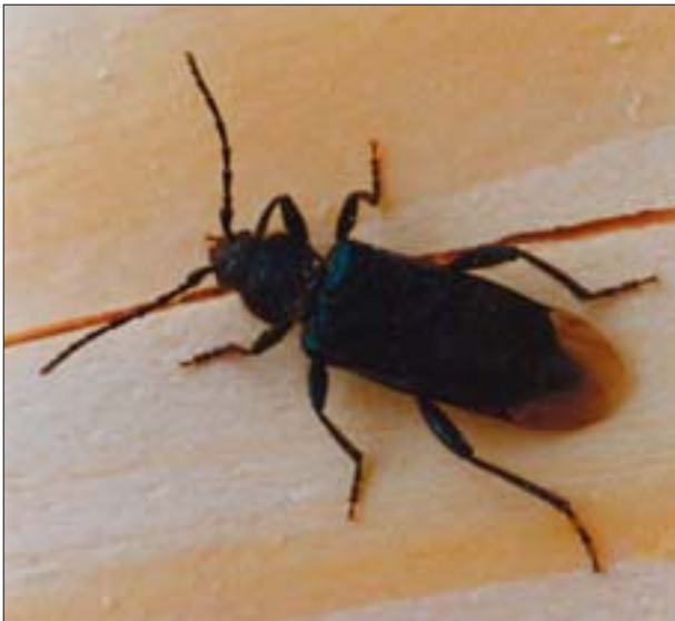
8. Chrząszcz zagwoździka fioletowego ( Callidium violaceum L.).

7. Chrysalis of Callidium violaceum L. extracted from timber.