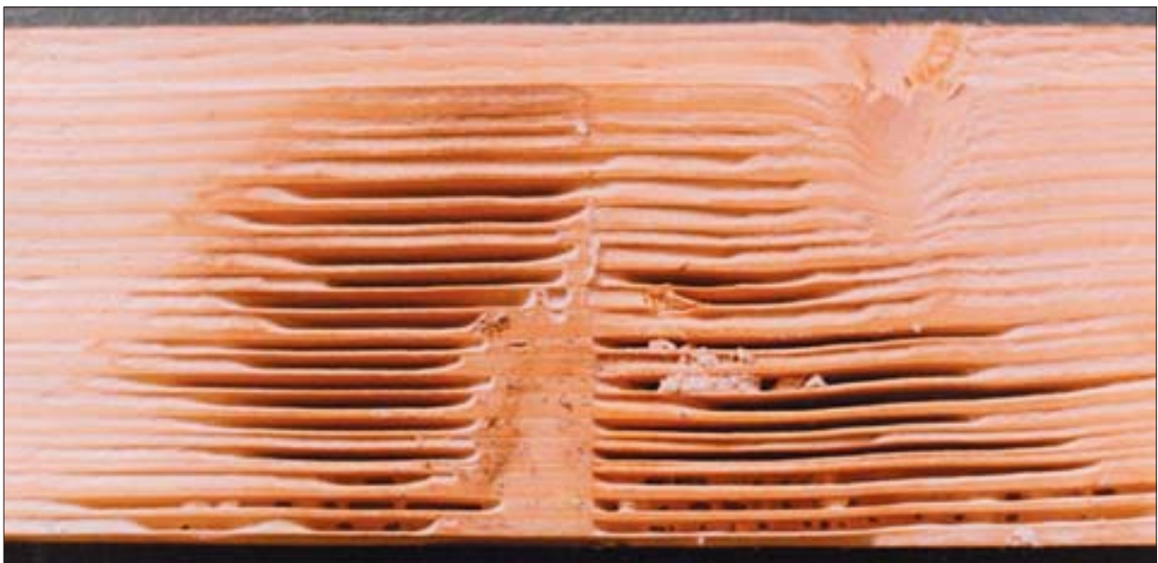
13. Uszkodzenia deseczki szalunku spowodowane przez mrówki, widok od strony wewnętrznej. 13. Damage caused by ants to panelling boards, view from the inside.

rozkładem brunatnym spowodowanym przez grzyby, owady te przyspieszają niszczenie podwalin, legarów, podłóg, rzadziej wyżej położonych części ścian czy nawet więźby dachowej. Niektóre gatunki, zwłaszcza palotocz mostowy, związane są ściśle z budownictwem wodnym 15 . Ze względu na znaczną liczebność tej grupy owadów, charakterystyczne, powtarzające się błędy posadowienia budynków, istnieje możliwość ochrony drewna dzięki stosowaniu zasad profilaktyki budowlanej. Do tej grupy owadów zaliczyć