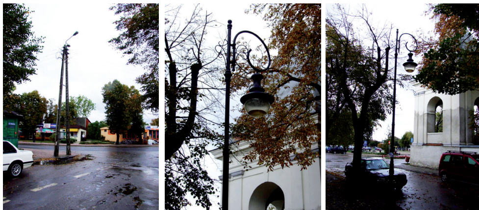
Ryc. 5. Formy oświetlenia Rynku Mariackiego przed rewitalizacją, październik 2008 roku