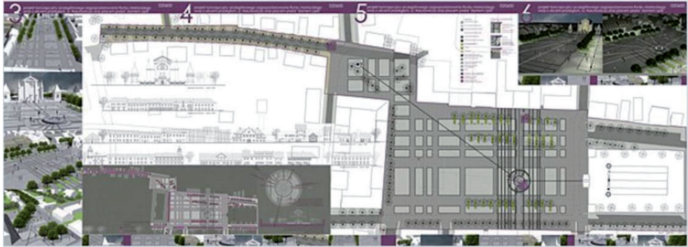
Ryc. 8. Plansze konkursowe przedstawiające zagospodarowanie Rynku Mariackiego i wnętrza z nim sprzężonych: placu przed „Domem Lipki” i ul. Narutowicza