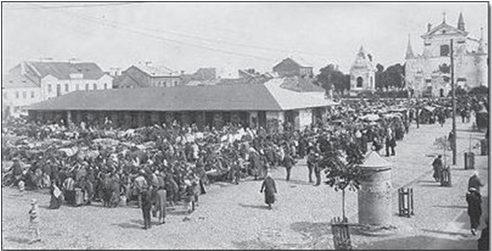
Ryc. 1. Fotografia Rynku Mariackiego w Węgrowie z lat 30. XX wieku