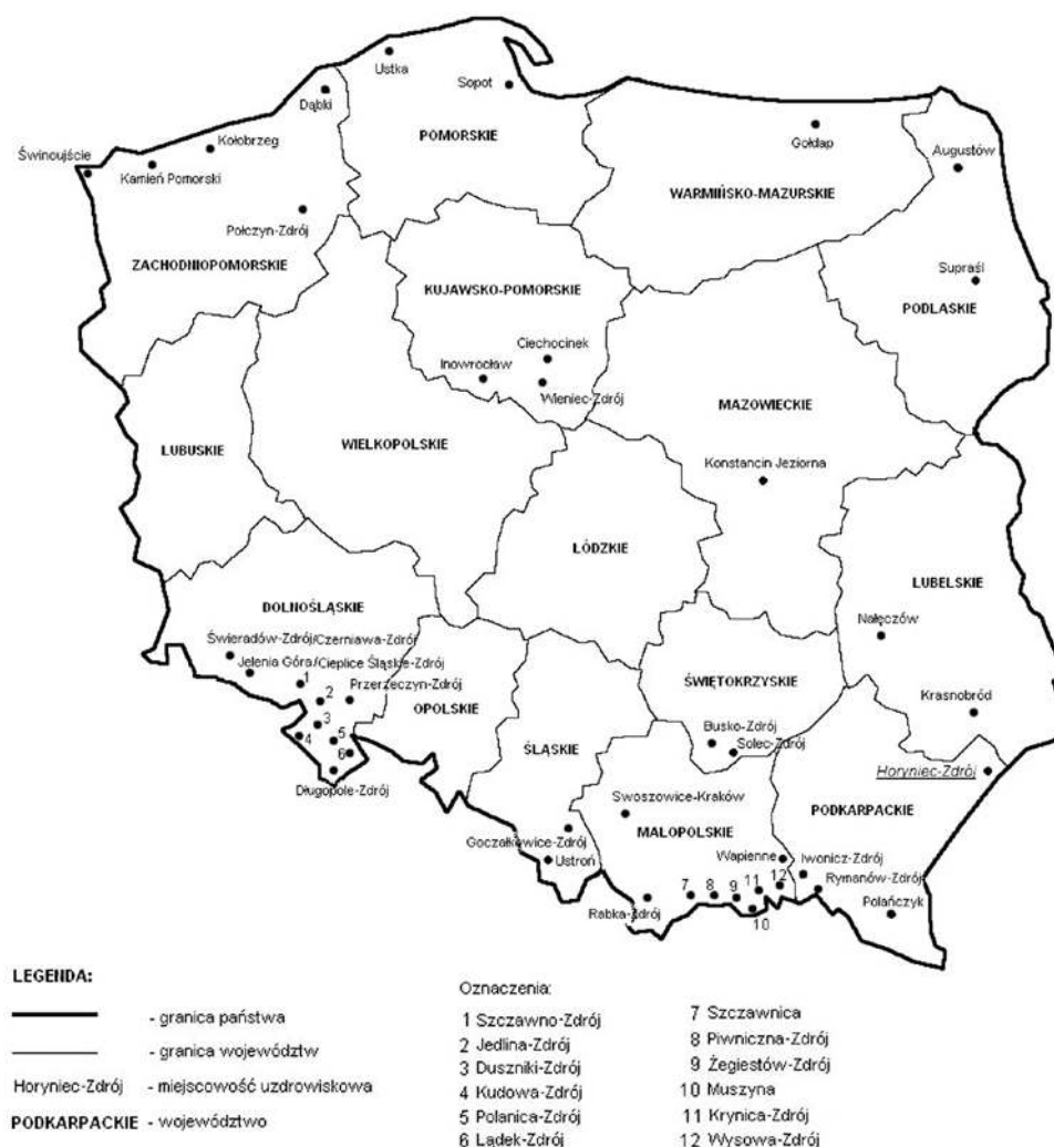
Ryc. 1. Położenie Horyńca-Zdroju na tle pozostałych uzdrowisk statutowych w Polsce