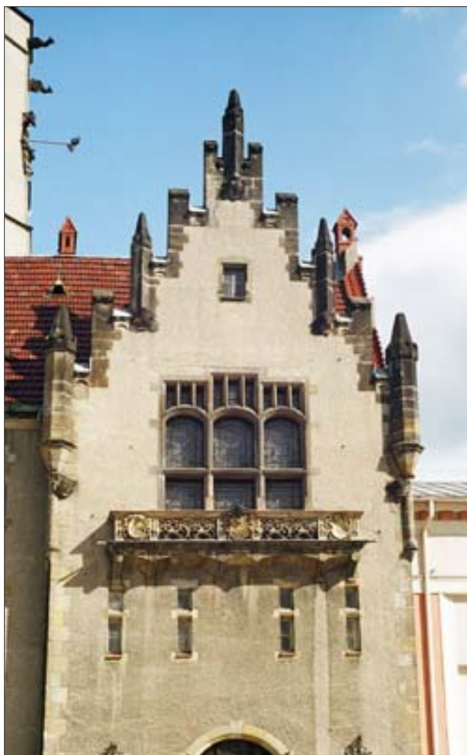
8. Fragment zachodniego ryzalitu fasady ratusza z widocznym oknem Sali Rajców. Fot. E. Rdzawska, 2004 r.

8. Fragment of the western projection of the town hall facade with a visible window of the councillors' hall. Photo: E. Rdzawska, 2004.