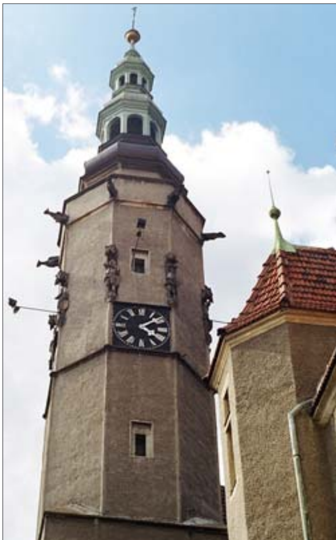
7. Gotycka wieża ratusza z XIV-wiecznymi kamiennymi rzeźbami figuralnymi. Fot. E. Rdzawska, 2004 r. 7. Gothic town hall tower with fourteenth-century figural stone sculptures. Photo: E. Rdzawska, 2004.

oraz potrzebą zachowania przejrzystego układu funkcjonalnego wnętrza. W Tarnowskich Górach, w ratuszu budowanym od podstaw, wejście w formie trój-arkadowej loggii podkreślało oś budynku.