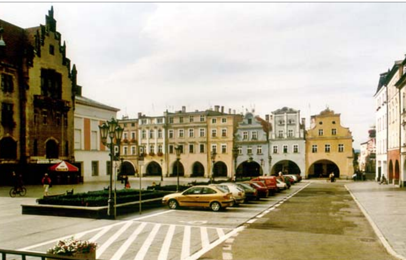
10. Zachodnia część pierzei południowej rynku z podcieniowymi domami. 10. Western part of the southern row of arcaded houses in the Market Square.