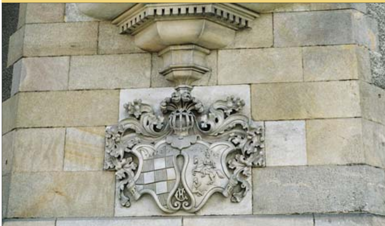
6. Kartusz z herbem Jawora umieszczony w płn.-zach. narożniku ratusza z widoczną sygnaturą inicjałów architekta „H. G.” (Hermann Guth). Fot. E. Rdzawska, 2004 r.