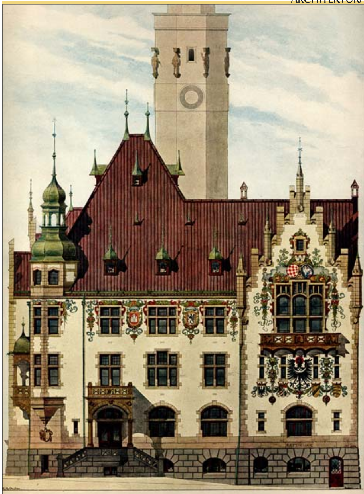
3. Ratusz w Jaworze, projekt kolorystyki fasady zachodniej z dekoracją malarską, arch. Hermann Guth z Charlottenburga, 1895 r. (wg Architektonische Rundschau, Skizzenblätter aus allen gebieten der Baukunst, Stuttgart 1901, tablica 72).

3. Town hall in Jawor – project of the western facade colour with painted decorations, architect: Hermann Guth from Charlottenburg, 1895 (acc. to: Architektonische Rundschau, Skizzenblätter aus allen gebieten der Baukunst, Stuttgart 1901, table 72).