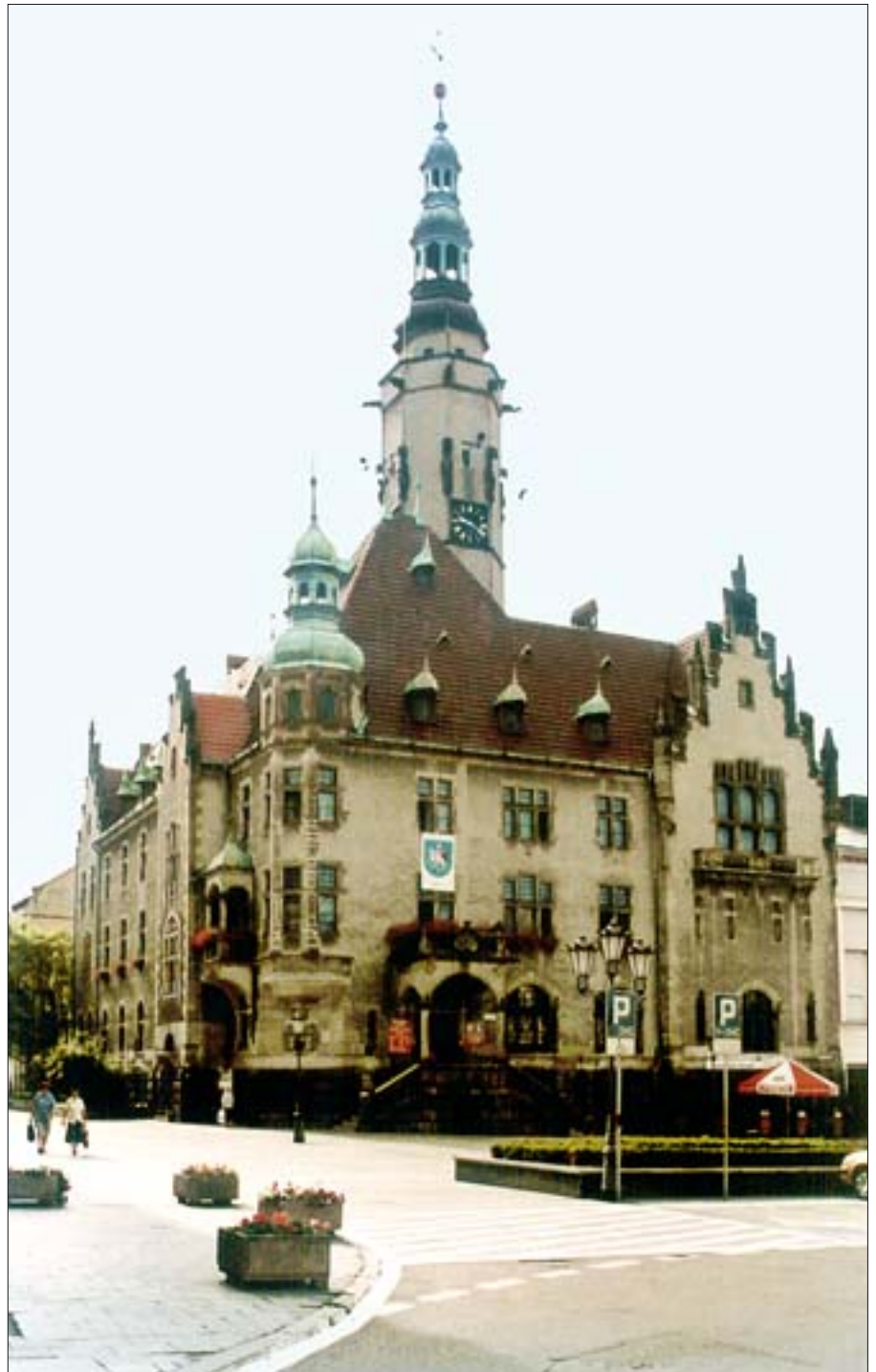
1. Widok ratusza od strony pn.-zach. Stan obecny. 2004 r.

Od początku swego istnienia miasto związane było z zamkiem książęcym sąsiadującym bezpośrednio z systemem obwarowań miejskich 3 . W latach 1301-1346 pełniło funkcję stolicy piastowskiego Księstwa Jaworskiego. Według przekazów Emanuela Fischera i G. Schöneicha, niemieckich kronikarzy, oraz ustaleń Edmunda Protokowicza, władzę zwierzchnią w Jaworze w latach 1300-1944 sprawowało 101 burmistrzów, wybieranych przez radnych miejskich za zezwoleniem królewskim, a po 1508 r. w myśl prawa wolnych wyborów miasta 4 .