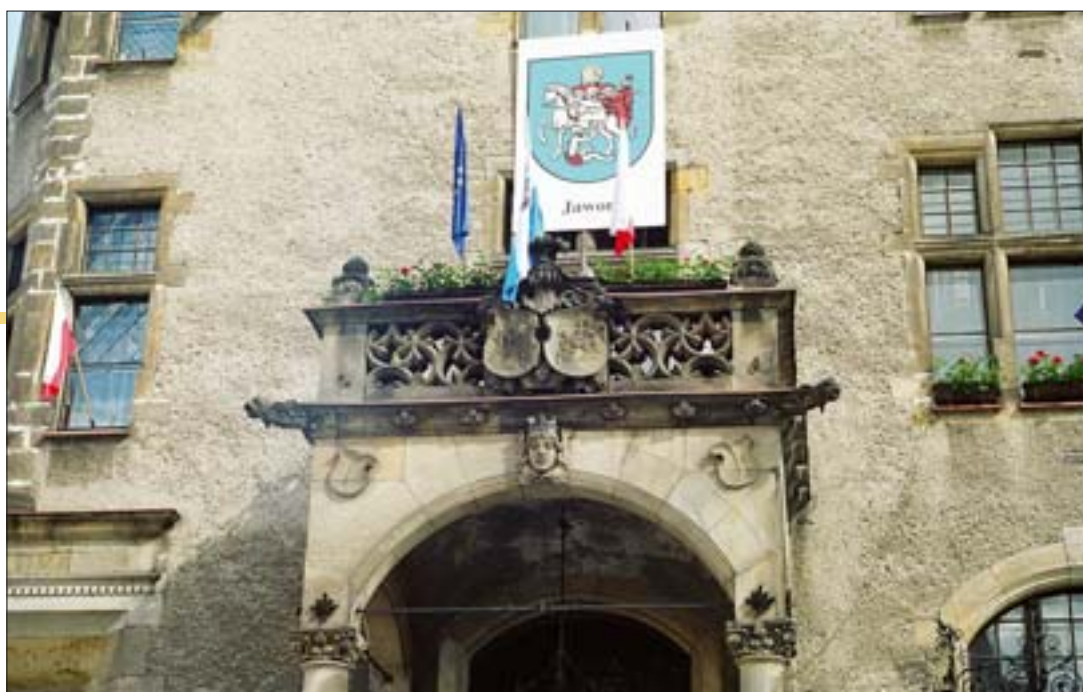
9. Fragment głównego portyku wejściowego zwieńczonego balkonem ozdobionym kartuszami herbowymi Jawora. Fot. E. Rdzawska, 2004 r.

Malowidła ścienne, które zdobiły elewację jaworskiego ratusza, przygotował i opracował malarz Kupers-Berlin 27 . Wykonane zostały w technice stereo-chromii 28 przy użyciu dekoracyjnych farb silikato-wych 29 . Zastosowana technika malarstwa ściennego, określana inaczej techniką krzemianową lub mineralną, oparta była na bazie spoiwa szkła wodnego służącego do związywania i utrwalania barwników. Ten sposób malowania elewacji zewnętrznych był popularny w końcu XIX w. zwłaszcza w Niemczech, ale nie stosowano go jeszcze w obiektach architektonicznych ówczesnych miast polskich 30 . Technika malowania tą metodą, stosunkowo prosta, wymagała jednak dużego doświadczenia i ostrożności ze względu na silnie alkaliczne działanie zastosowanych spoiw. Zbliżona była w pewnym stopniu do technik malar-skich fresku suchego oraz fresku mokrego. W stereo-chromii potrzebna była jednak dobrze przygotowana jednolita sucha zaprawa, na którą – tak jak we fresku suchym – przenoszono rysunek za pomocą wcześniej przygotowanych patronów. Sam proces malowania wymagał zwilżonego podłoża i polegał na kładzeniu farb sposobem „mokre w mokrym”, podobnie jak w technice fresku mokrego.