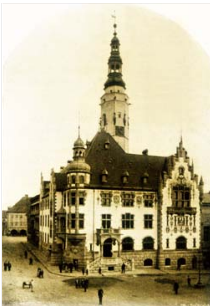
2. Widok ratusza od strony płn.-zach. Na fasadzie widoczne malowidła dekoracyjne. Fot. z ok. 1901 r. (wg Architektonische Rundschau, Skizzenblätter aus allen gebieten der Baukunst, Stuttgart 1901, s.b.n.).

W 1740 r. Jawor przeszedł pod panowanie Prus. Kolejne przekształcenia rynku i ratusza związane były z groźnymi pożarami, które nawiedziły miasto. Jeden z nich, w 1776 r., strawił 137 domów frontowych i inne zabudowania. Po nim, za czasów panowania Fryderyka II, nastąpiła generalna odbudowa rynku 13 , który otoczony został z czterech stron muraowanymi kamieniczkami z arkadowymi podcieniami. W 1799 r. przebudowano również przylegające do ratusza sukiennice, wprowadzając w tym miejscu budynek teatru. Kolejny wielki pożar miał miejsce w 1846 r., a ostatni, który zniszczył niemal doszczętnie stary ratusz i najbliższe zabudowania, wybuchł 12 marca 1895 r. Po tym pożarze nastąpiła gruntowna odbudowa ratusza, zakończona – jak podają źródła – 22 listopada 1896 r. 14