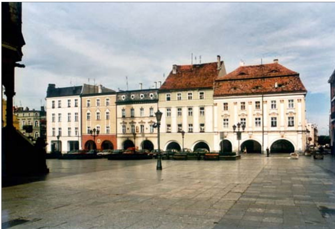
12. Pierzeja zachodnia rynku z podcieniowymi domami. Fot. E. Rdzawska, 2004 r.