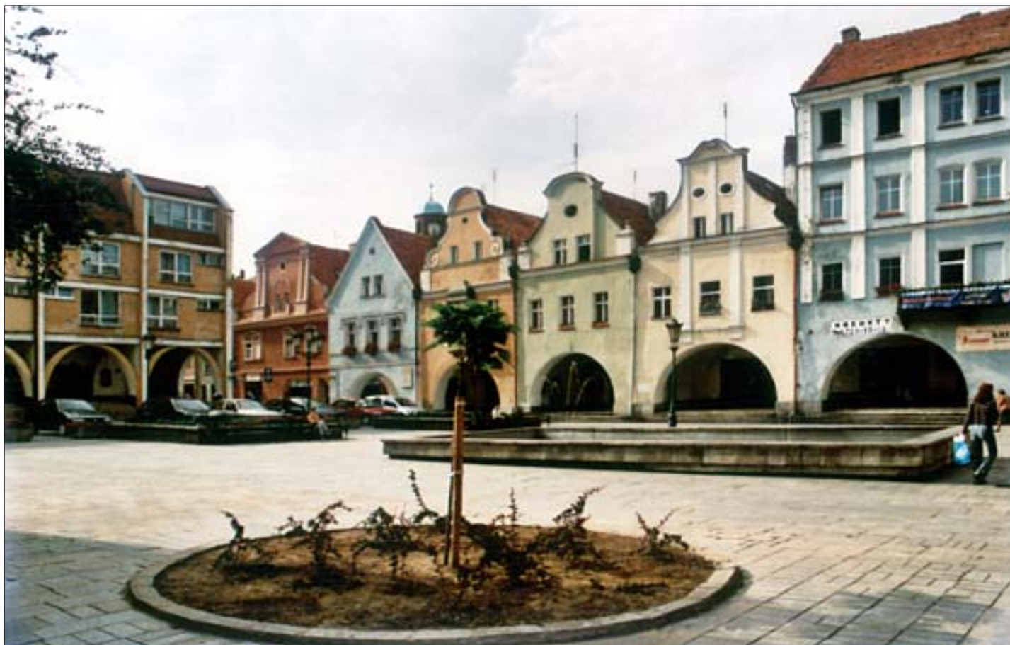
11. Wschodnia część pierzei południowej rynku z podcieniowymi domami. Fot. E. Rdzawska, 2004 r. 11. Eastern part of the southern row of arcaded houses in the Market Square. Photo: E. Rdzawska, 2004.

a funkcjonujące w praktyce konserwatorskiej do lat 50. XX w., o słuszności usuwania w trakcie prac renowacyjnych wszelkich zbędnych i szpecących „naleciałości XIX-wiecznych”. Aż do połowy lat 60. architektury powstałej po 1855 r. nie uznawano za obiekty zabytkowe, nie było podstaw naukowych do ich prawnej ochrony 33 . Dotyczyło to zarówno obiektów o cechach eklektycznych, secesyjnych, jak i reprezentujących neostyle. Takie poglądy umacniały negatywne emocje wzbudzone przez architekturę