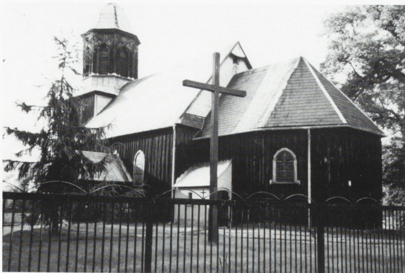
Mórka, kościół p.w. NMP Wniebowziętej.

Prace remontowe prowadzono w l. 1992–1999. Drewniane elementy konstrukcji szachulcowej znajdowały się w złym stanie tech-