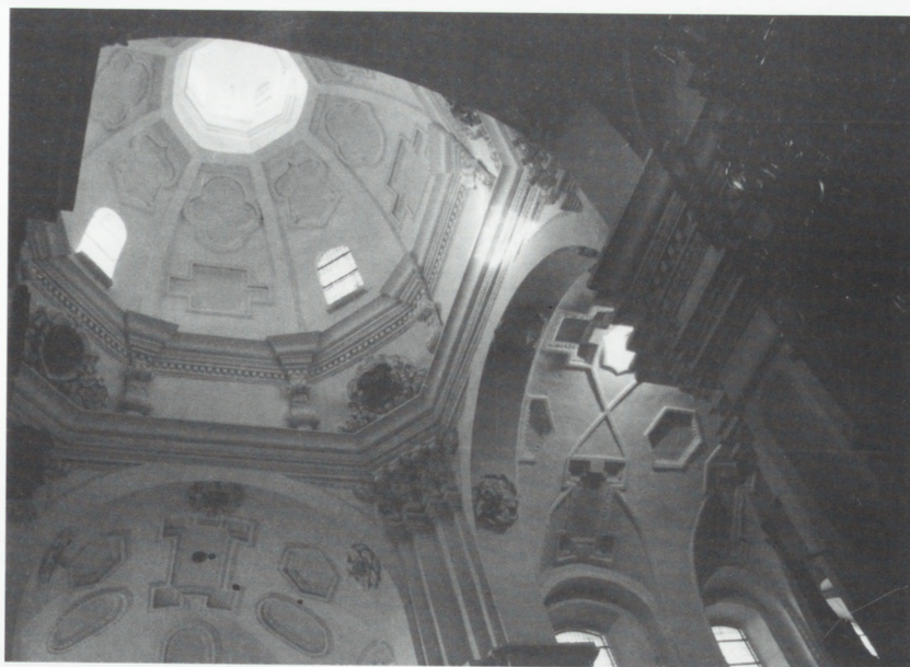
Sieraków, kościół p.w. NMP Niepokalanie Poczętej — fragment wnętrza po konserwacji.

Zbudowany w 1779 r. Nr rej. 586/A z 1969 r. W 1995 r. prze-