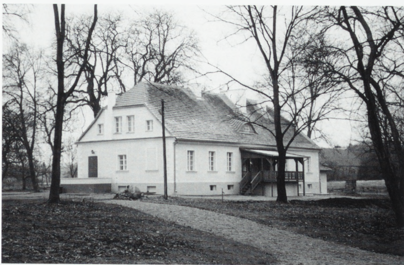
Chalin, dwór, elewacja ogrodowa, obecnie Centrum Edukacji Ekologicznej.

W 1995 r. przeprowadzono remont generalny polegający na impregnacji elementów drewnianych środkami ogniochronnymi, wykonaniu nowego oszalowania, wymianie stolarki okiennej i drzwiowej, wykonaniu nowej posadzki, przemurowaniu szachulcowej zakrytii z kruchtą, wymianie pokrycia dachowego.