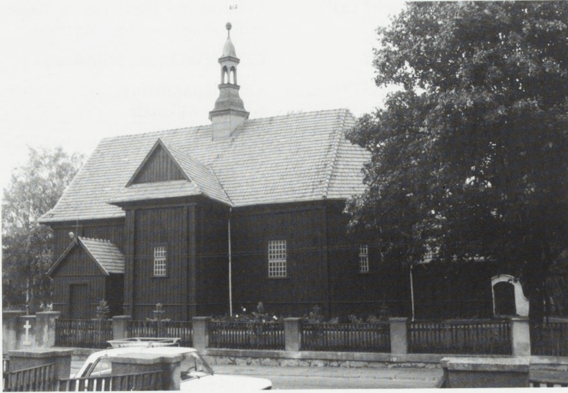
Chludowo, kościół p.w. Wszystkich Świętych.