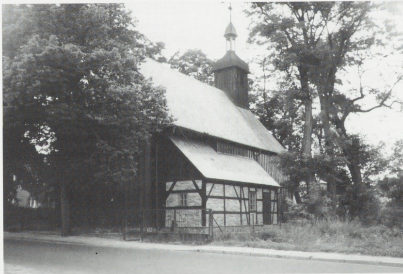
Dolsk, kościół p.w. Św. Ducha.

Wykonawca: Edward Ząbek z Istebnej, na podstawie ekspertyzy technicznej inż. Macieja Stankowskiego.