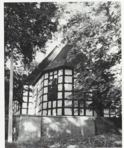
Gultowy, kościół p.w. św. Kazimierza.

W 1999 r. wykonano prace polegające na skuciu tynków zewnętrznych do wysokości 2 m oraz usunięciu płyt betonowych wokół kościoła w celu osuszenia murów. Jest to etap przygotowawczy do remontu elewacji kościoła.