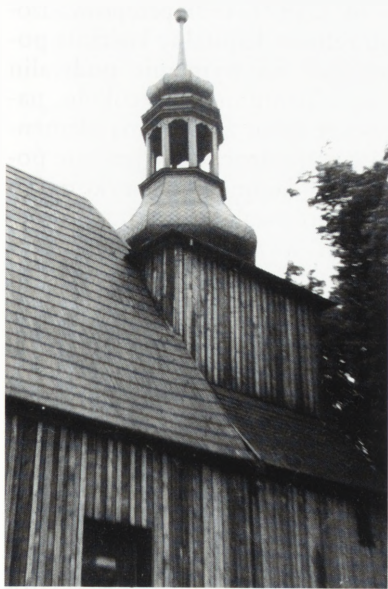
Brody, kościół p.w. św. Andrzeja Apostoła — wieża.

Kościół znajdował się w krytycznym stanie technicznym grożącym katastrofą budowlaną. Przeprowadzono w l. 1991–1999 prace remontowe polegające na rekonstrukcji wieży, naprawie konstrukcji dachu i jego pokrycia, wymianie stropu, przemurowaniu uszkodzonych partii murów, regotyzacji okien.