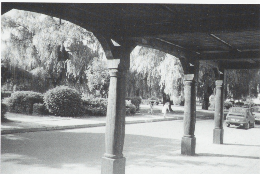
Rakoniewice, fragment domu podcieniowego po konserwacji.

nicznym, zaatakowane przez drewnojady oraz zniszczone przez korozję biologiczną, w wielu miejscach całkowicie utraciły własności konstrukcyjne. Do tej pory przeprowadzono około 90% prac konstrukcyjnych polegających na wymianie zniszczonych belek podwalinowych, zniszczonych słupów i rygli w ścianach szachulcowych prezbiterium i nawy, oczyszczeniu całości konstrukcji drewnianej i konserwacji jej preparatami owadobójczymi, grzybobójczymi i ognioochronnymi. Wykonano także remont hełmu na wieży.