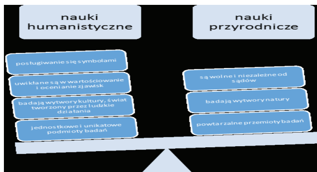
Rys. 2. Różnice pomiędzy naukami humanistycznymi a przyrodniczymi

(m.in. Giddens 2010; Hejnicka-Bezwińska 2010) lub nowoczesności refleksyjnej (Bauman 2008), nastąpiły zmiany w obszarze sposobów i celów poznania w ogóle. Epistemologiczny charakter zmian, o którym pisze m.in. Teresa Hejnicka-Bezwińska (2010, s. 43), polega głównie na rezygnacji z orientacji pozytywistycznej i zwrócenie uwagi na cechy charakterystyczne dla nauk społecznych, którym bliżej do nauk humanistycznych niż przyrodniczych (Rys. 2).