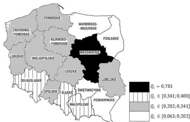
Rysunek 1. Podział województw według stanu gospodarki odpadami w 2015 roku w Polsce