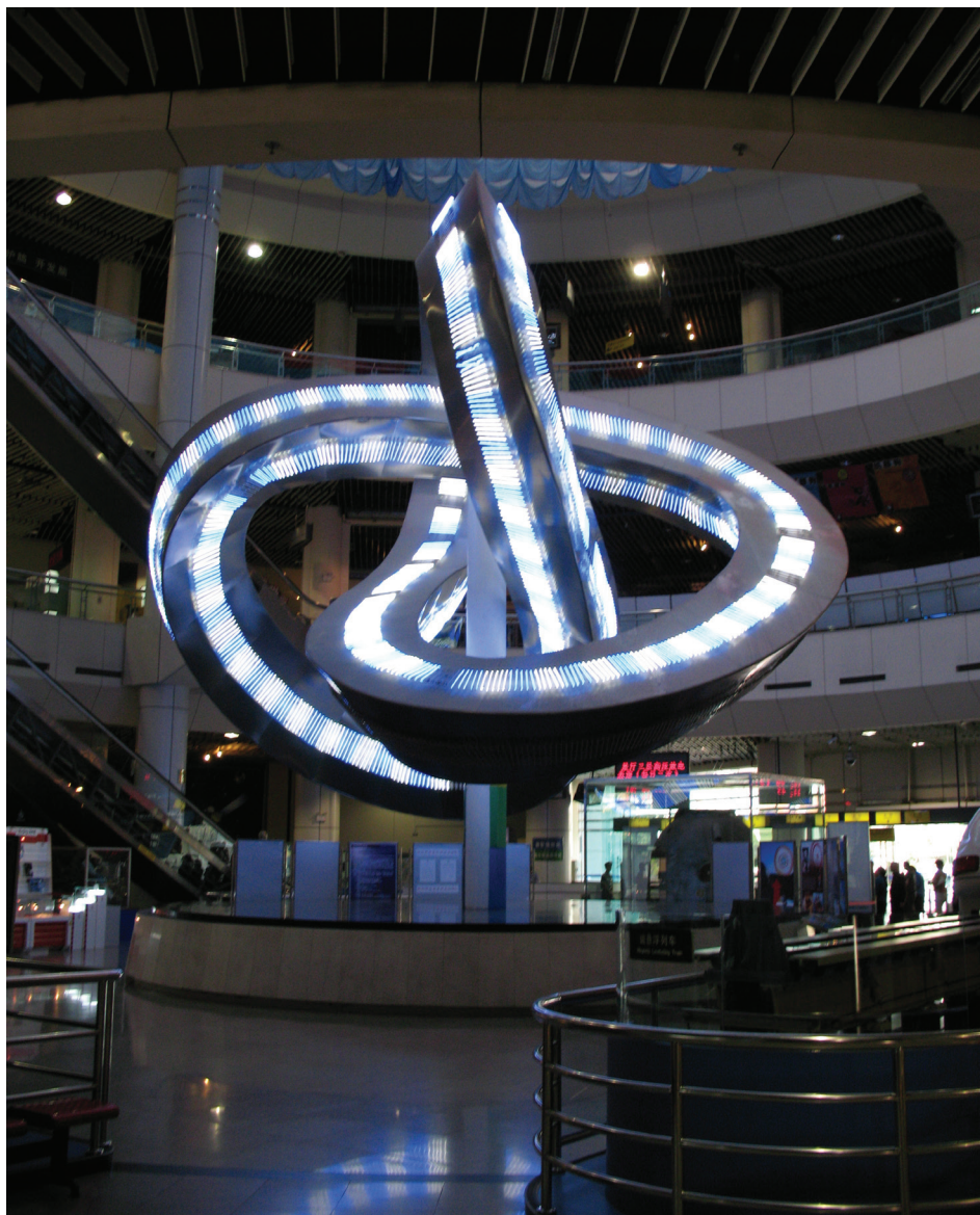
Il. 2. Iluminacja struktury przestrzennej sterowana przez program komputerowy. Ekspozycja w Muzeum Nauki i Techniki w Pekinie