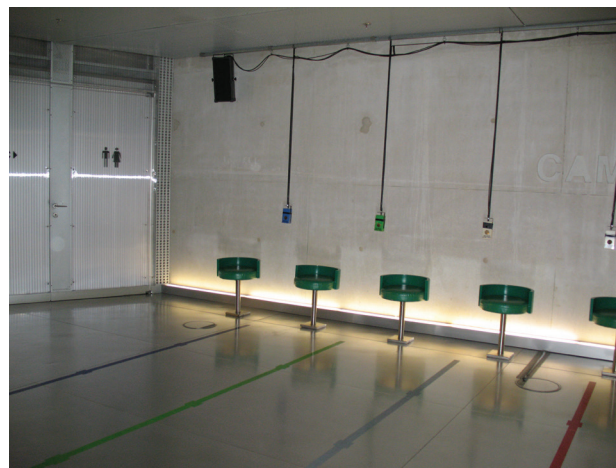
Il. 4. Generowanie dźwięków w przestrzeni przez ruchy człowieka. Ekspozycja w Casa da Música w Porto

Fig. 3. Generating of the light-pixels by man's motion. Exhibition, The National Art Museum of China, Beijing