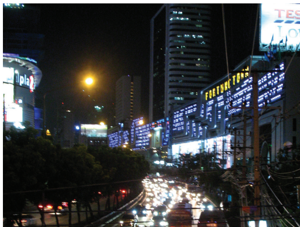
Il. 5. Struktura przestrzenna jako przepływ energii świetlnej. Fasada medialna sterowana programem komputerowym, Bangkok