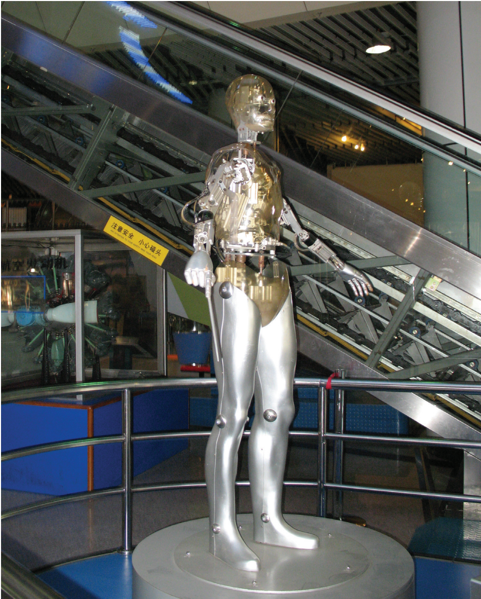
Il. 1. Uczłowieczony robot – zrobotyzowany człowiek. Ekspozycja w Muzeum Nauki i Techniki w Pekinie