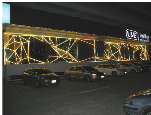
Il. 6. Struktura przestrzenna jako przepływ energii świetlnej. Fasada medialna sterowana programem komputerowym, Bangkok