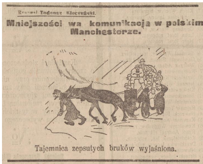
„Kurier Łódzki” 26 kwietnia 1924