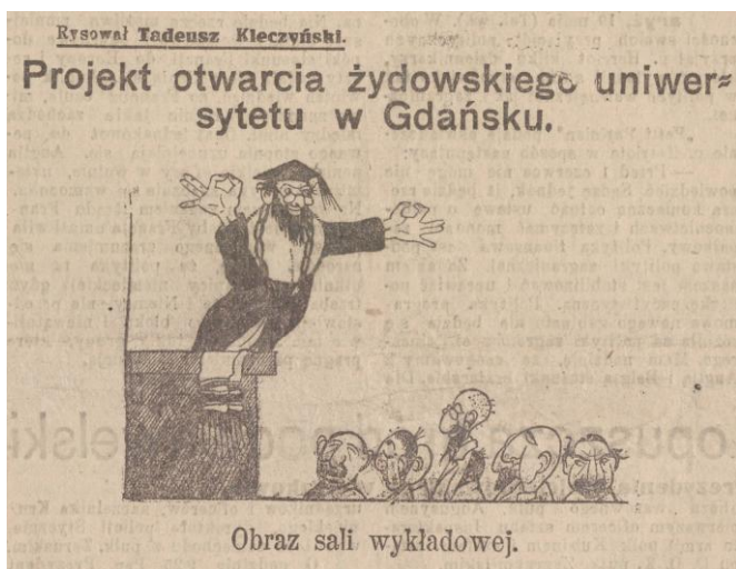
„Kurier Łódzki” 20 maja 1924