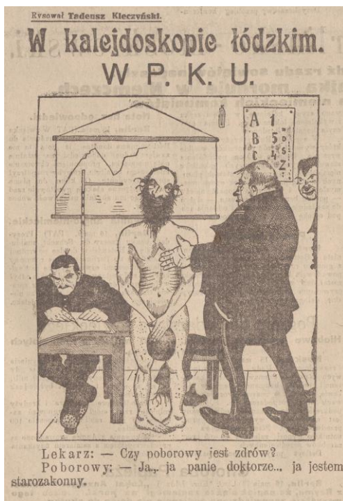
„Kurier Łódzki” 17 maja 1924