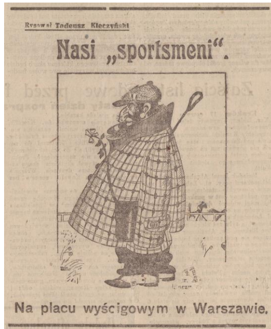
„Kurier Łódzki” 18 czerwca 1924