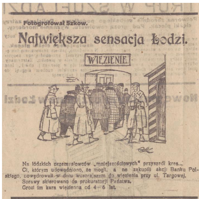
„Kurier Łódzki” 1 kwietnia 1924