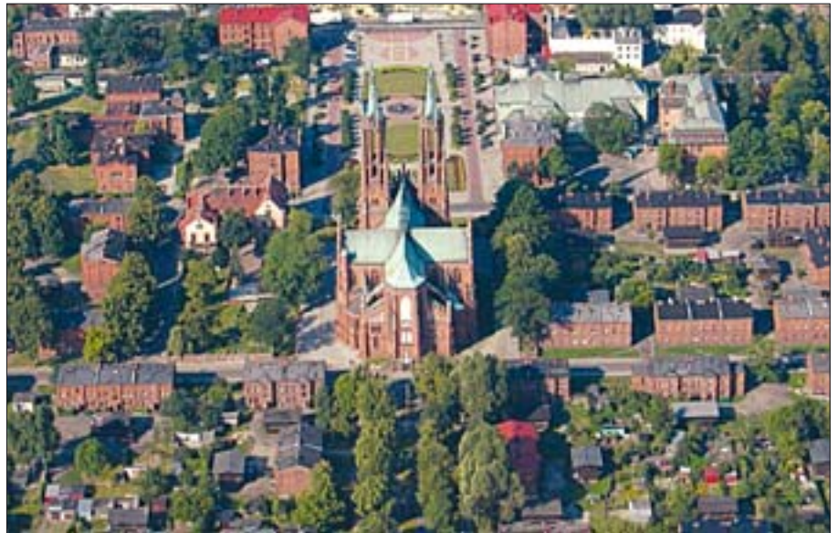
1. Żyrardów, osada fabryczna.

Idea rewitalizacji, wraz z propagowanym przez Unię Europejską wyrównywaniem szans rozwoju zdegradowanych obszarów miast i wsi, staje się coraz bardziej rozpowszechniona. Przeznaczone na te cele fundusze unijne koordynowane są przez urzędy marszałkowskie poszczególnych województw. Informację