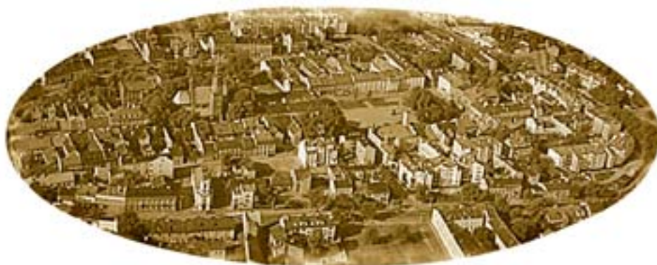
3. Radom, Miasto Kazimierzowskie, lata 30. XX w.