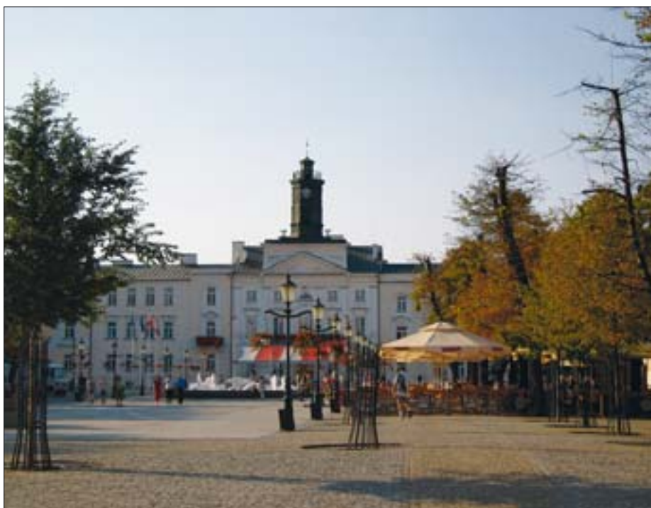
6. Płock, rynek z ratuszem.

Podczas dyskusji prowadzonych na zakończenie każdego z „piątków” pojawiało się wiele zagadnień i wspólnych dla wszystkich spotkań tematów. Były to m.in. sprawy związane z dalszym zachowaniem i użytkowaniem zabytkowych centrów miast. Omawiano przyczyny zagrożeń, wynikających zarówno z wieloletnich zaniedbań w utrzymaniu technicznym miejskiej zabudowy, wyludniania się obszarów historycznych, jak i niewłaściwego