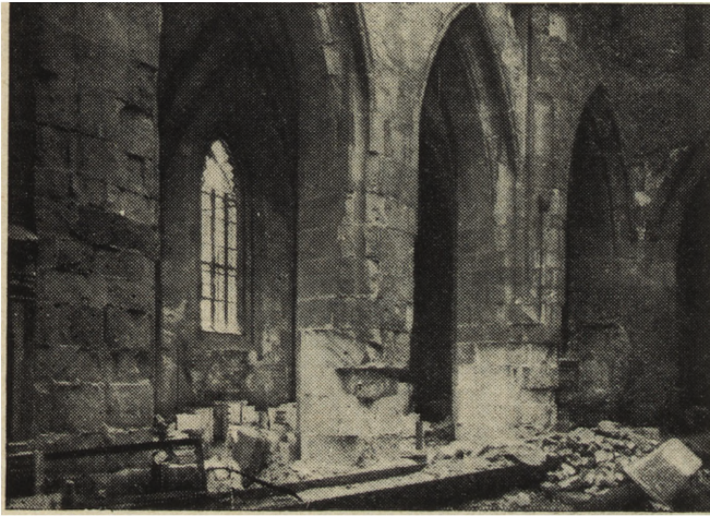
Ryc. 17. Wrocław — katedra, zniszczenie dolnych partii filarów nawy głównej.

Drugi kwartał 1948 r. powinien w myśl programu przynieść dokończenie robót murarskich i kamieniarskich w nawie głównej, pokrycie dachu. Równocześnie są już w pełnym toku przygoto-