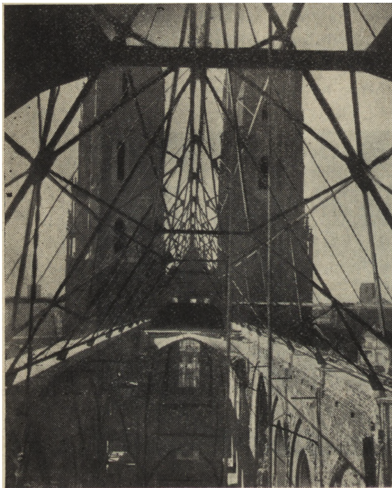
Ryc. 18. Wrocław — katedra, odbudowa więźby dachowej.

W wielu wypadkach widzimy też powierzchowność i nieszczerość przedwojennej konserwacji zabytków wrocławskich. Lecz problemy te, jako też niektóre błędne wnioski konserwatorów niemieckich, wymagają osobnych rozważań i opracowania.