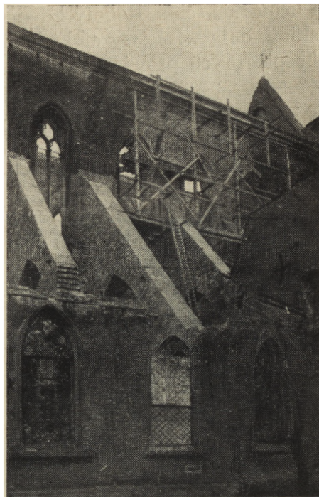
Ryc. 14. Wrocław — katedra, zamurowanie mniejszej wyrwy w ścianie południowej.

Dalszy program robót zabezpieczających i konserwatorskich poszedł w kierunku uzupełnienia i wzmocnienia pozostałych murów, przygotowania budowli do przyjęcia ciężaru dachu i sklepień oraz założenia dachu z pokryciem. W tym celu należało przede wszystkim wypełnić 2 wielkie wyrwy ściany południowej przez wymurowanie kilku filarów międzyokiennych z obramieniami kamiennymi względnie profilowanej cegły. Następnie trzeba było po prześklepieniu uzupełnić ściany i gzyms, — w końcu łuki przyporowe. Z dniem 1 marca br. ukończono mury nawy głównej i łuki przyporowe południowe, w toku jest czyszczenie