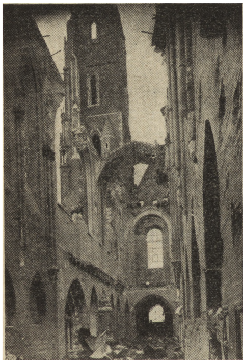
Ryc. 15. Wrocław — katedra, wnętrze nawy głównej po zniszczeniu wojennym.

giem okoliczności wnętrza ich nieuszkodzone. Sklepienia naw bocznych, podobnie jak i łuki przyporowe uległy znacznie większemu zniszczeniu od południa, aniżeli od północy. Nad prezbiterium nie ma sklepień, nad nawą główną pozostało jedno przeszło barokowe. Zarówno mury jak i sklepienia pozostałe uległy bardzo silnemu zarysowaniu. Poza szczerbami w nawie głównej oraz trudną do obliczenia ilością pomniejszych uszkodzeń i odkształceń — pożar