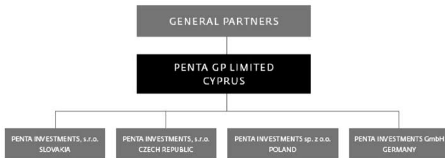
Ryc. 1. Struktura firmy Penta GP Limited Cyprus

Obok EM & F kluczową inwestycją Penty w Polsce jest grupa Iglotex, producent i dystrybutor mrożonek 37 . W sierpniu 2013 roku do mediów dotarła informacja, że Penta kupuje sieć aptek Mediq, zarządzanych dotychczas przez grupę ACP Pharma. Po sfinalizowaniu transakcji polska część aptek należąca do Penty będzie liczyć blisko 300 punktów i stanie się drugim największym podmiotem aptecznym w Polsce. Z kolei należąca dotychczas do Penty sieć aptek Dr. Max wzmocni pozycję w Polsce i przyspieszy ekspansję (70 aptek w Polsce) 38 .