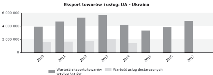
Rys. 1. Polski eksport na rynek ukraiński na przestrzeni lat 2010-2017

Rok: 2010, 2011, 2012, 2013, 2014, 2015, 2016, 2017 Kraj: UA - Ukraina Waluta: tys. USD