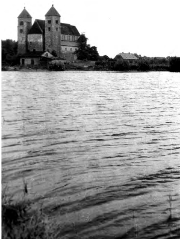
3. Archikolegiata w Tumie pod Łęczyczą. Widok od strony zachodniej w czasie powodzi latem 1960 r.

Drugi etap prac konserwatorskich — prowadzonych zresztą w fatalnych warunkach atmosferycznych — nastąpił w Tumie osiem lat później i trwał od 20 czerwca do 1 października 1960 r. (czerwiec — prace przygotowawcze, wrzesień i październik — pra-