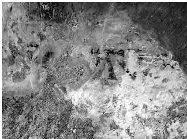
7. Fragmenty liter romańskich na pasie podłucza w apsydzie zachodniej.