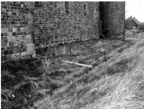
2. Fragment murów archikolegiaty od strony południowej. System odprowadzania wody opadowej gromadzącej się w dolnych partiach murów. grudzień 1998 r.

2. Fragment of the church walls to the south. System for carrying off rainwater gathering in the lower parts of the walls. December 1998