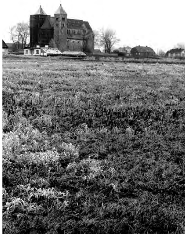
4. Archikolegiata w Tumie pod Łęczyczą. Widok od strony zachodniej w grudniu 1998 r.

3. Arch-collegiate church in Tum near Łęczycza. View to the west during the flood in the summer of 1960.