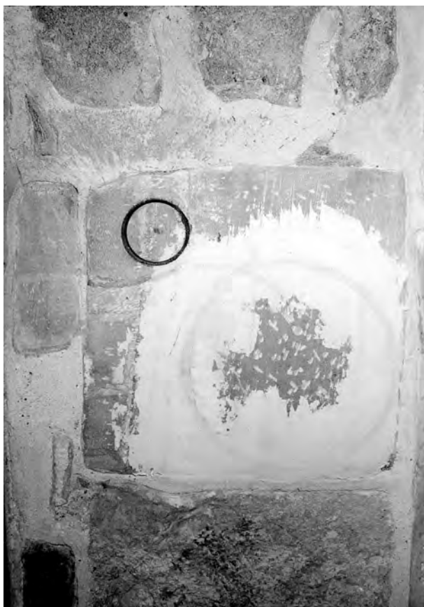
6. Ślady po niefortunny wykonanych odwiertach w 1998 r. w filarach celem pobrania materiału budowlanego do badań. Fot. R. Stasiuk, grudzień 1998 r.

6. Traces of bore-holes in the pillars, incorrectly made in 1998 for the purpose of taking samples of building material. Photo: R. Stasiuk, December 1998