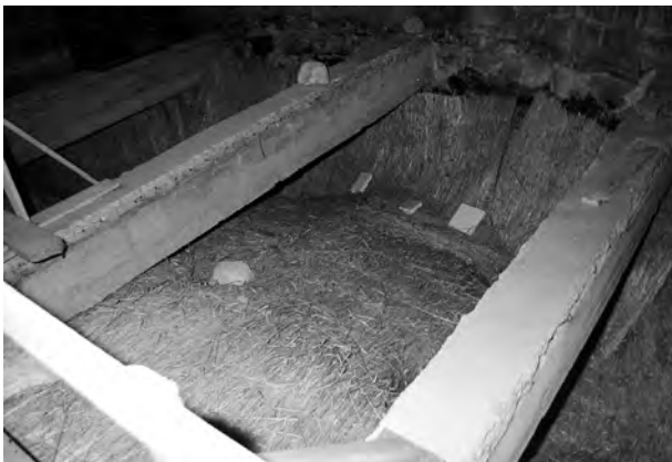
1. Archikolegiata w Tumie pod Łęczycą. Doraźna izolacja termiczna konchy z malowidłem romańskim wykonana z mat słomianych po usunięciu czapy betonowej. Fot. R. Stasiuk, grudzień 1998 r.

Romańska archikolegiata w Tumie pod Łęczycą należy do tych zabytków w Polsce, których odbudowa i konserwacja ciągnie się niemal przez cały okres powojenny, czyli prawie pół wieku. W dramatycznym okresie rozbitcia dzielnicowego, w którym pod koniec XIII w. istniało już ponad dwadzieścia księstw, w miarę niezależnych i nierzadko wojujących ze sobą twórców terytorialno-administracyjnych, wzniesiono imponującą jak na owe czasy liczbę budowli sakralnych i świeckich. W wieku XII — okresie głównego nasilenia ruchu budowlanego, który koncentrował się na