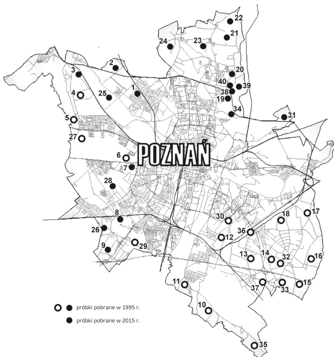
Ryc. 1. Lokalizacja pobrania próbek glebowych na terenie Poznania w latach badań

czając punkty w środku kwadratu o bokach 0,2 km × 0,2 km (ryc. 1). Zasadą było niepobieranie materiału glebowego z terenów zieleni miejskiej, gdzie gleby są pochodzenia antropogenicznego. Próbki zostały pobrane w roku 1995 oraz 2015 z tych samych miejsc, przy czym lokalizacja była weryfikowana za pomocą mapy oraz lokalizatora GPS. Próbki były pobierane z wierzchniej warstwy gleby do głębokości 25 cm. Próbkę średnią uzyskano z połączenia 6–10 próbek pojedynczych. W roku 1995 kolekcja obejmowała 40 próbek glebowych. W roku 2015 do analizy pobrano tylko 20 próbek, ponieważ obszary w przeszłości wykorzystywane w celach rolniczych obecnie zostały przeznaczone pod zabudowę mieszkaniową bądź usługową. W związku z tym badanie oparto na materiale glebowym obejmującym po 20 gleb reprezentujących 1995 i 2015 rok. Spośród pobranych w 2015 roku próbek glebowych aż 45% pochodzi z gruntów ornych, lecz obecnie nieużytkowanych rolniczo, co zaznaczono w tabeli 1.