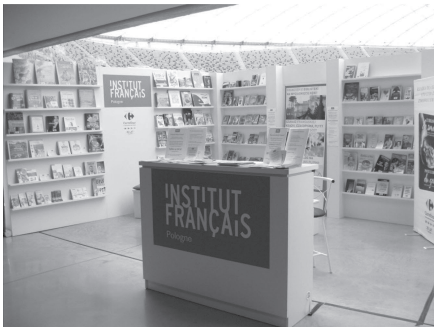
Fot. 4. Stoisko Instytutu Francuskiego w Polsce