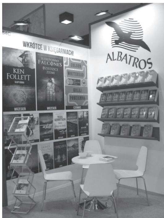
Fot. 2. Ekspozycja wydawnictwa Albatros