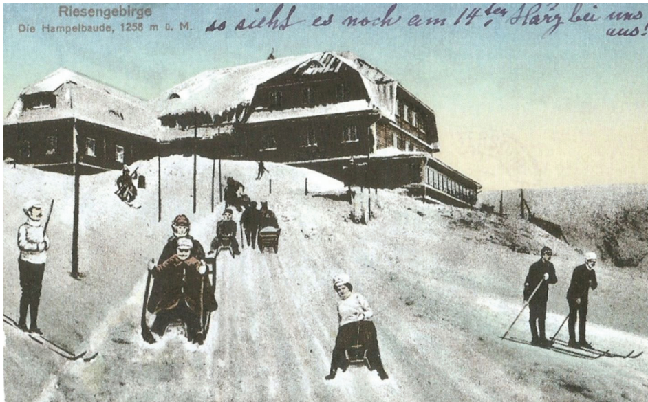
Il. 4. Zjazd sani rogatych spod Hampelbaude (dziś Strzecha Akademicka), pocztówka barwna około 1917, Wyd. Männich and Höckerdorf, Hirschberg