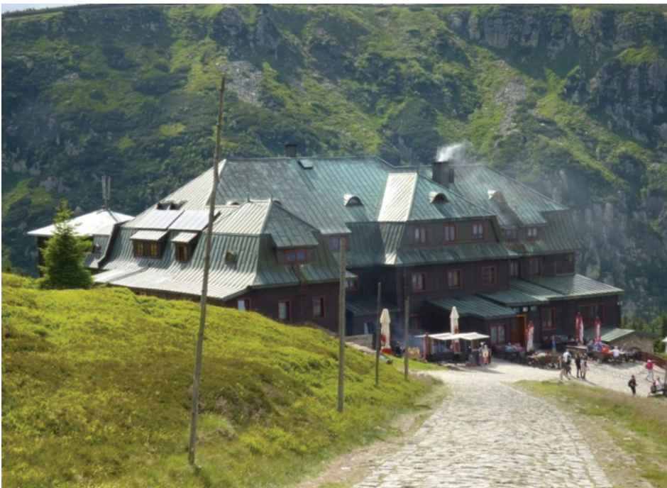
Il. 5. Schronisko Strzecha Akademicka – dach wielospadowy z mansardami pokryty blachą

After the war, Strzecha Akademicka shelter was taken over by the Jagiellonian University and then by students of Cracow's universities (Central Academic Sports Association), and its present name comes from this period. During renovations which were carried out after 1945, the colours of the facades were changed, and the roof was covered with sheet metal which was preserved until today (Fig. 5). The form and significant elements of the building have not been changed.