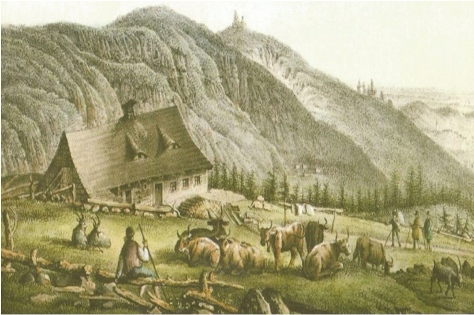
Il. 1. Wypas bydła. Buda Hampła (prawdopodobny wygląd obiektu w latach 1789–1881).

Wyd. C. Mattis, 1. poł. XVIII w., litografia kol., 11 × 15 cm, (źródło: Muzeum Karkonoskie, MJG AH 3080)