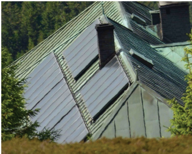
Il. 7. Kolektory słoneczne na dachu schroniska Strzecha Akademicka