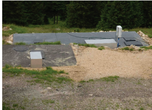
Il. 6. Zbiornik oczyszczalni ścieków dla schroniska Strzecha Akademicka

Obecna sytuacja schroniska, zdaniem autora niniejszego artykułu, jest dość skomplikowana. Przed jego właścicielami stoi sporo kwestii do rozwiązania. Jedną z podstawowych jest określenie, na których turystów się zdecydować i jak najlepiej się do nich dostosować. Nie mniej ważny jest problem ze statusem prawnym schronisk czy problem