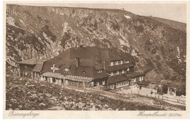
Il. 3. Widok Hampelbaude (obecnie Strzecha Akademicka), około 1920, Rübezahl-Druckerei u. Verlag Höckendorf, Hirschberg i. Rsgb.

Ed. C. Mattis (1789–1881), 1826, a lithography, 11 × 15 cm