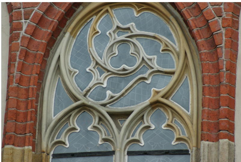
Maswerki wrocławskiej katedry

Traceries in the Wrocław cathedral