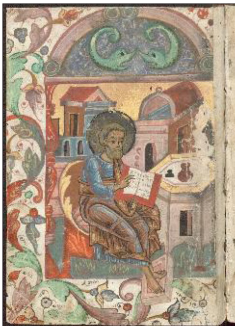
Fot. 1. Miniatura ew. Marka.