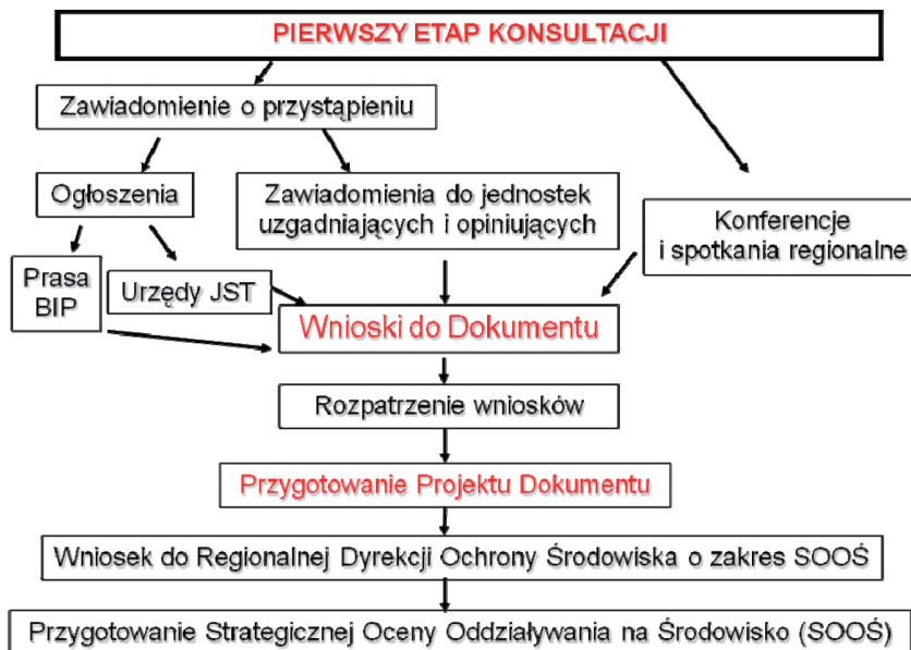
Rys. 3. Pierwszy etap konsultacji społecznych dokumentów strategicznych województwa mazowieckiego

szy etap konsultacji przygotowujący jest projekt dokumentu, a następnie wniosek do Regionalnej Dyrekcji Ochrony Środowiska o zakres Strategicznej Oceny Oddziaływania na Środowisko. Dokument ten jest przygotowujący we własnym zakresie, jedynie we współpracy z ekspertami.