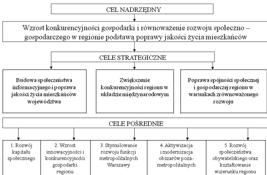
Rys. 1. Układ celów Strategii Rozwoju Województwa Mazowieckiego