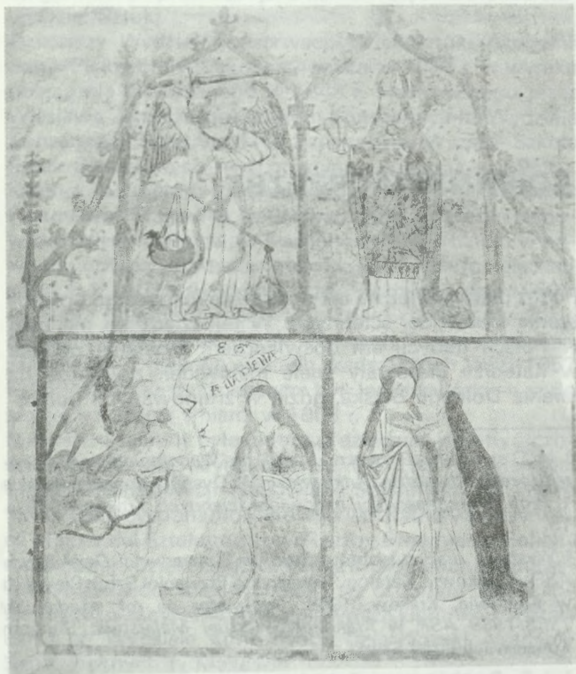
1. Tymowa, woj. legnickie, kościół filialny p.w. Najświętszej Marii Panny. Fragment odkrytego malowidła z ok. 1504 r. (nawa, prawa strona ściany tęczowej) — stan po konserwacji, 1977

1. Tymowa, Legnica voivodeship, church under the invocation of Our Lady. Fragment of uncovered painting from ca. 1504 (nave, right side of rainbow wall) — state after conservation, 1977