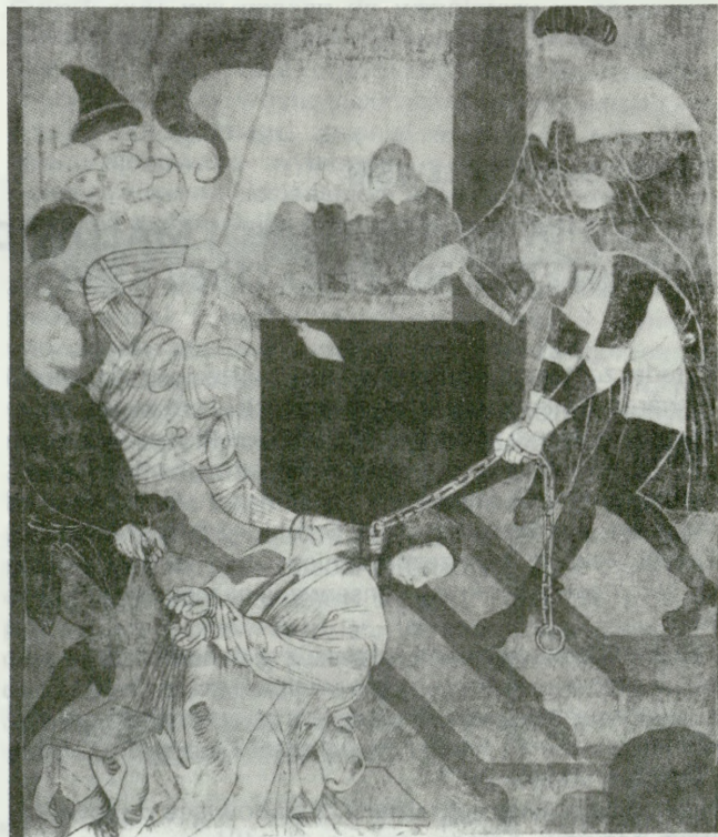
2. Jawor, woj. legnickie, kościół poklasztorny Bernardynów, obecnie Muzeum. Fragment odkrytego malowidła z XVI w. (nawa, ściana północna) — stan po konserwacji, 1980

1. Tymowa, Legnica voivodeship, church under the invocation of Our Lady. Fragment of uncovered painting from ca. 1504 (nave, right side of rainbow wall) — state after conservation, 1977