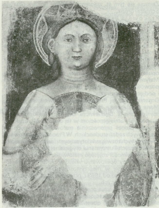
4. Manerba Del Garda (południowa nawa, boczna ściana wschodnia) — stan po konserwacji, 1988

3. Kłębanowice, Legnica voivodeship, church under the invocation of St. Hedwig. Fragment of uncovered painting (chancel, southern wall) — state during conservation, 1988