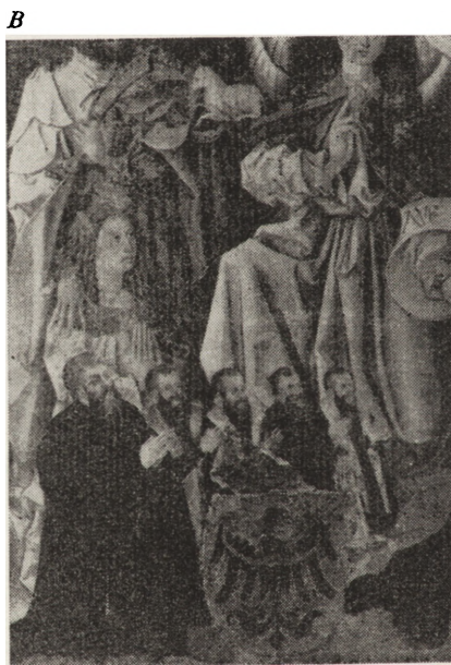
3. Obraz wotywny z ok. 1480 r. ze sceną Zwiastowania: A — fragment przed konserwacją; B — po konserwacji

Wśród prezentowanych na wystawie prac na szczególną uwagę zasługiwały te, w wyniku których doszło do ciekawych odkryć, np. zmiany atrybucji zabytku, czy dotarcia do oryginalnej kolorystyki lub kompozycji. W grupie takich prac należy przede wszystkim wymienić konserwację rzeźby gotyckiej z kościoła urszulanek we Wrocławiu, przedstawiającej św. Jadwigę. W czasie badań wstępnych ustalono, iż była to pierwotnie figura Marii z kręgu stylowego „Pięknych Madonn”, a św. Jadwigą stała się dopiero w XIX w. przez dodanie modelu kościoła trzebnickiego zamiast Dzieciątka, przybranie głowy mitrą książęcą oraz gruntowne przemalowanie powierzchni rzeźby. Po konserwacji, mimo znacznych ubytków formy i polichromii, rzeźba odzyskała swoją pierwotną treść i artystyczną wyjątkowość.